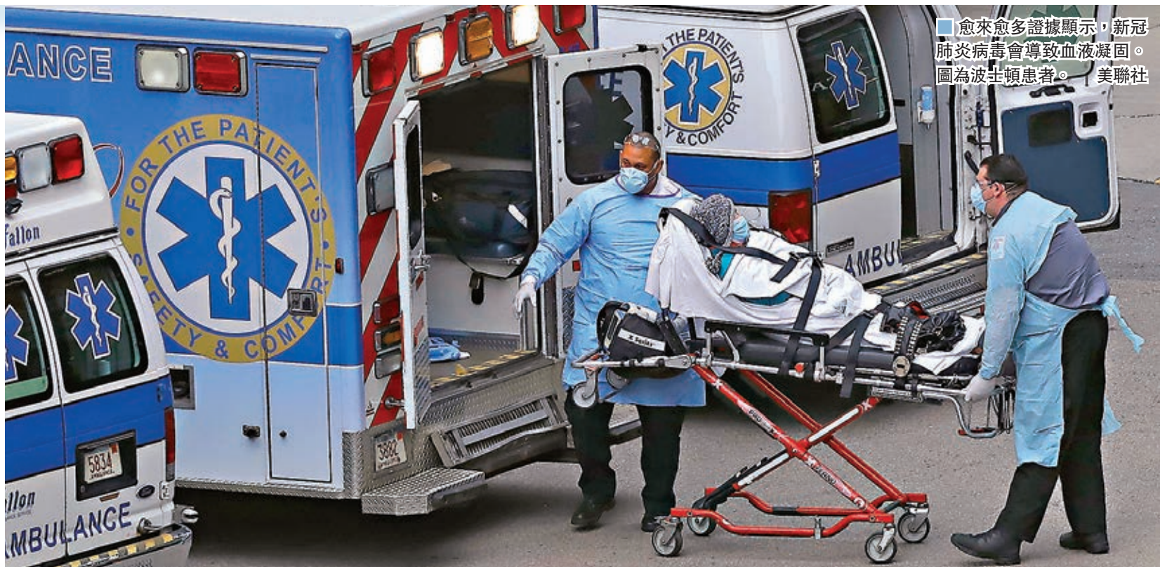
愈來愈多證據顯示，新冠肺炎病毒會導致血液凝固。圖為波士頓患者。