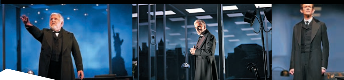
■NTLive《雷曼兄弟三部曲》劇照