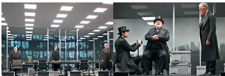
■NTLive《雷曼兄弟三部曲》劇照

四個小時的《雷曼兄弟三部曲》，把這個「家族史」用說書般的方式「唱」出來。從第一幕雷曼先生在1844年9月11日經歷45天航程抵美，交代出其德國移民的身份。雷曼在阿拉巴馬州做小生意白手興家，為了討生活什麼買賣都願意做。三年後雷曼二位兄弟都來了，隨着消費需求逐漸對經營有