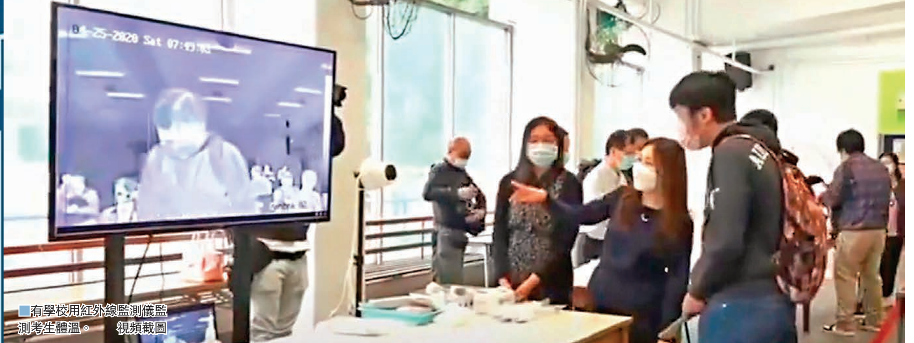
有學校用紅外線監測儀器監測考生體溫。 視頻截圖

中學文憑試 (DSE) 昨日舉行第二日考試，考評局指，共有14名考生因病缺席考試，其中兩人因發燒或呼吸道感染症狀而被拒進入試場，1人隨即送院作檢測試，正等待結果；有兩人到試場後因身體不適而離開，包括1名考生疑因緊張致腸胃不適於試場洗手間嘔吐，最終自行離場未有應試。教育局局長楊潤雄表示，首兩天考試過程大致順利，但明日開始將有約5萬名考生的4個核心科應考，對試場運作會是一項挑戰 (見另稿)。 ■香港文匯報記者 高鈺