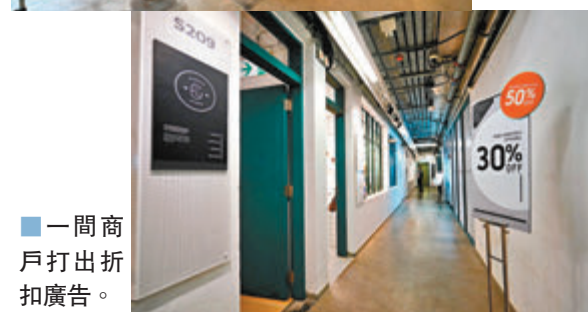
■一間商戶打出折扣廣告。