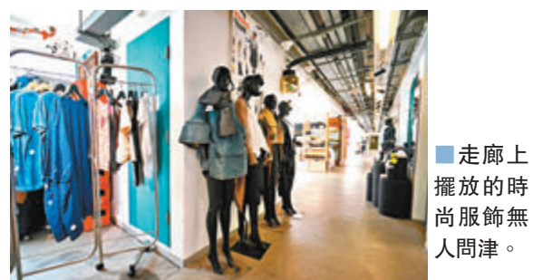
■走廊上擺放的時尚服飾無人問津。