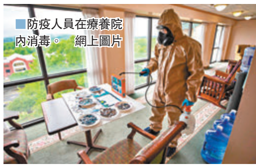
防疫人員在療養院內消毒。