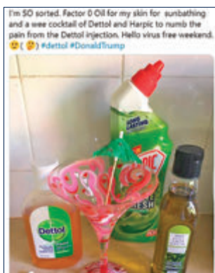
網民自製「滴露雞尾酒」，大家切勿亂學。