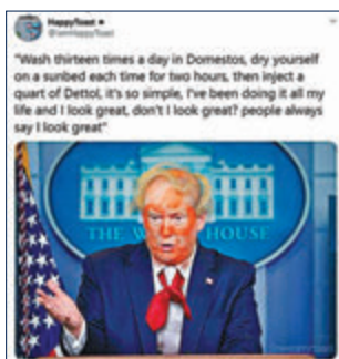
網民惡搞特朗普被照射紫外光及注射消毒劑。