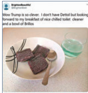
網民笑稱將潔廁液視為「早餐」。網上圖片