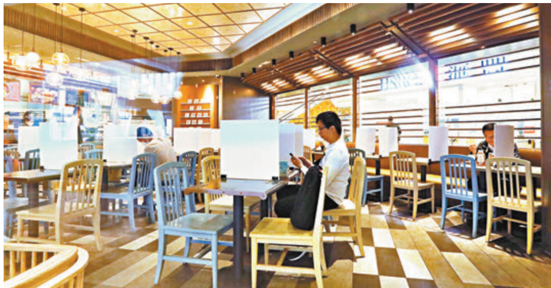
專家提醒市民切勿鬆懈。圖為食肆用膠板分隔座位。

另外，醫管局昨日公佈，昨有26名確診病人出院，累計康復人數增至725人，仍有307名確診病人分別於14間醫院留醫，當中5人情況危殆、7人嚴重，其餘295人穩定。目前公院1,130張負壓病床，使用量為42.4%，579間負壓病房的使用量為57.9%。