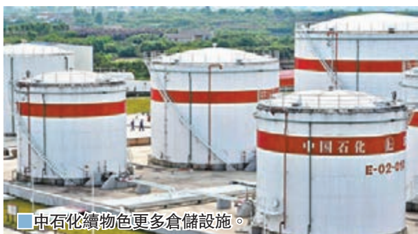
中石化儲物色更多倉儲設施。

涉及隱瞞約8億美元期貨交易虧損，集團銀行債務最少30億美元。中石化昨收報3.78元，升0.53%。