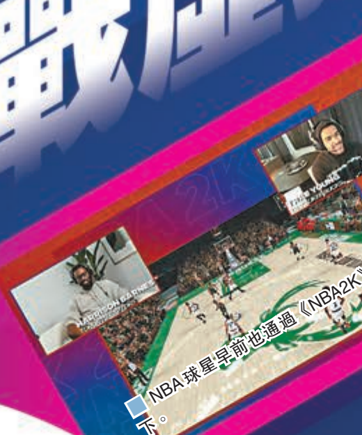
NBA球星早前也通過《NBA2K》一決高下。 網圖