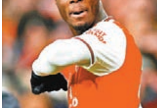
尼高拉斯比比聚眾玩耍。