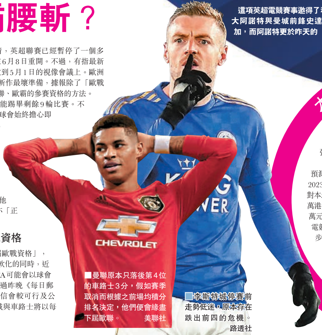
曼聯原本只落後第4位的車路士3分，假如賽季取消而根據之前場均積分排名決定，他們便會緣盡下屆歐戰。

這項英超電競賽事選得了利物浦後衛阿歷山大阿諾特與曼城前鋒史達寧等多隊球星參加，而阿諾特更於昨天的「雙紅會」以5:1