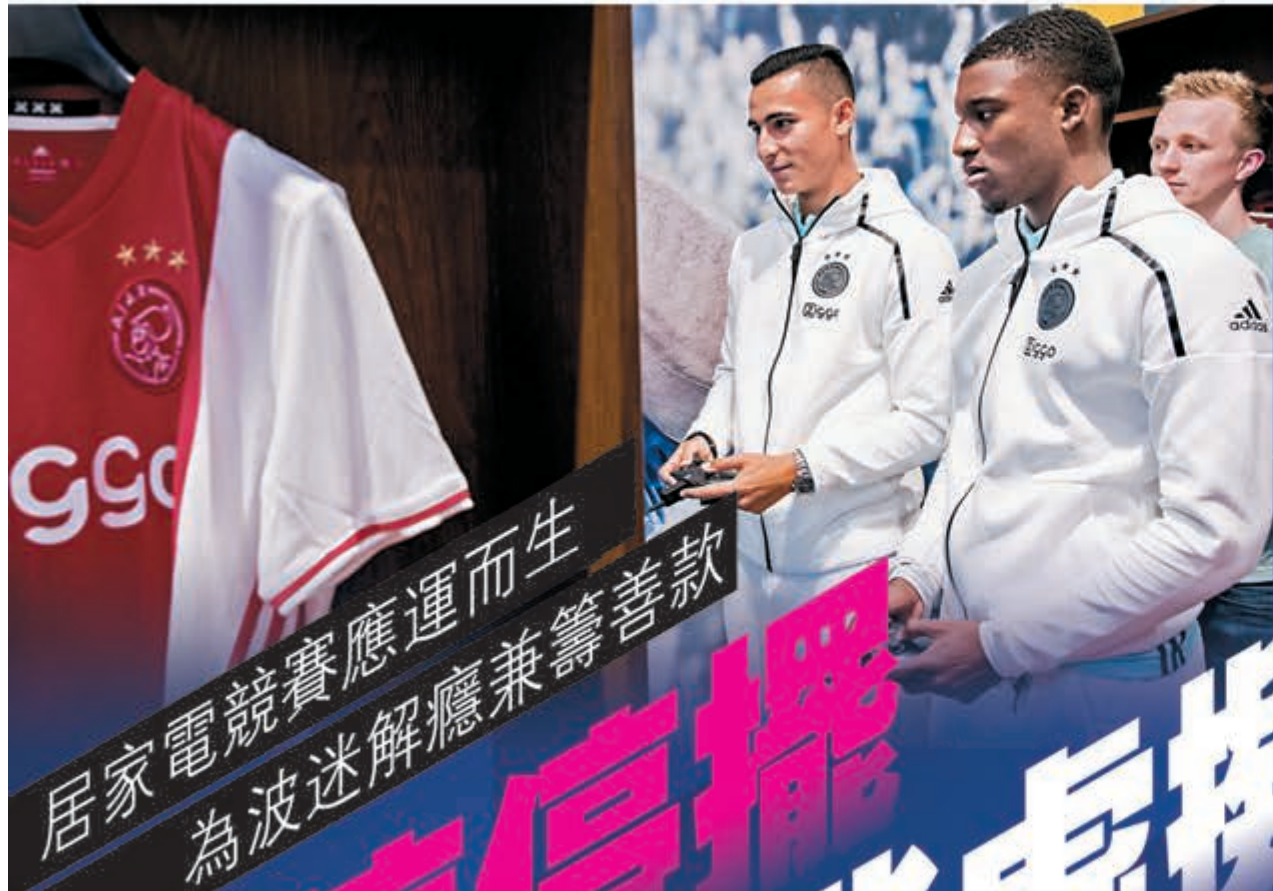
足球名將往往能夠將場上戰術，融入到遊戲世界之中。