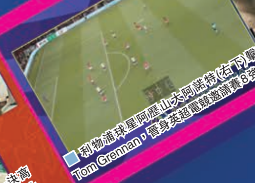
利物浦球星阿歷山大阿諾特(右)擊敗了曼聯代表Tom Grennan，奪得英超電競邀請賽8強。 網圖