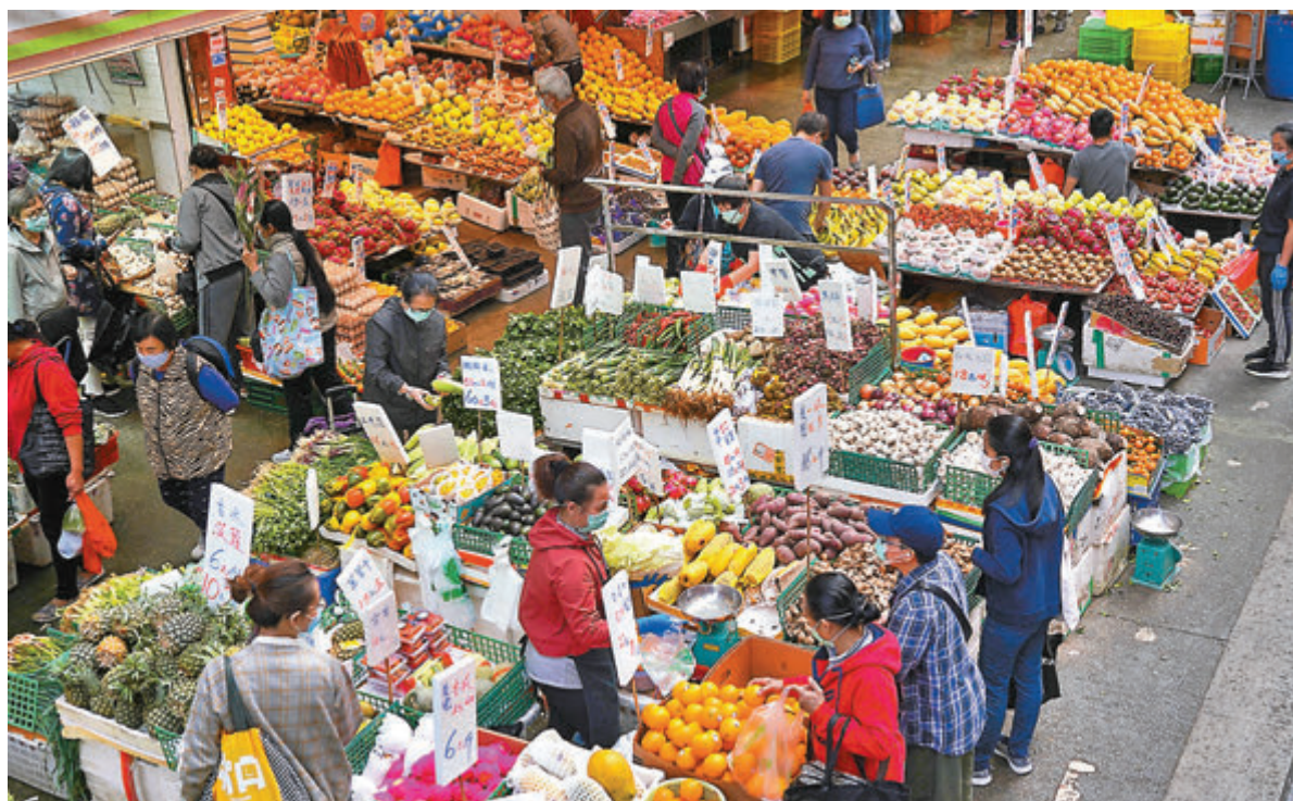
因避疫減少外出用膳，上月非外出用膳的食品物價指數按年急升13%。圖為市民到街市買菜。

經濟走下坡之際，香港物價卻高企不下，市民生活百上加斤。政府統計處昨日公佈本港上月消費物價指數，整體消費物價按年上升2.3%，較今年首兩個月合計的平均升幅1.8%為高。因應新冠肺炎疫情，市民減少外出，在家用膳機會增加，但上月非外出用膳的食品物價指數按年急升13%，外出用膳的食品物價則僅升1.6%，加重市民的經濟負擔。至於上月基本通脹率為2.6%，較今年首兩個月合計的平均升幅為低，主要是由於豬肉價格升幅收窄所致。