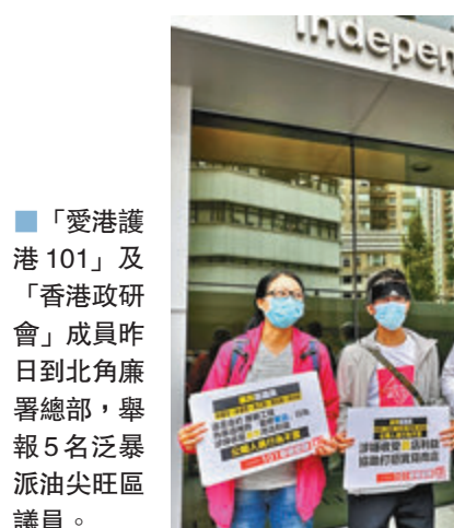
「愛港護港101」及「香港政研會」成員昨日到北角廉署總部，舉報5名泛暴派油尖旺區議員。

香港文匯報訊（記者 郭家好）全港飲食業都在疫情下艱苦求存，但泛暴派區議員繼續政治先行。有民間團體昨日向廉政公署舉報5名泛暴派油尖旺區議員，懷疑他們推翻西洋菜南街一帶閉路電視系統的更新工程，目的是為協助暴徒打砸不同政見商店，更可能收受了區內「黃店」的利益，要求廉政公署調查。