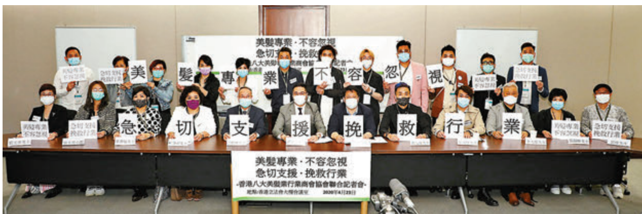
從事美髮業的八大協會促請特區政府於第二輪防疫基金中，能惠及業界。

政府雖推出的兩輪防疫抗疫基金救市，惟仍有部分行業未能受惠包括美髮業。從事美髮業的八大協會包括香