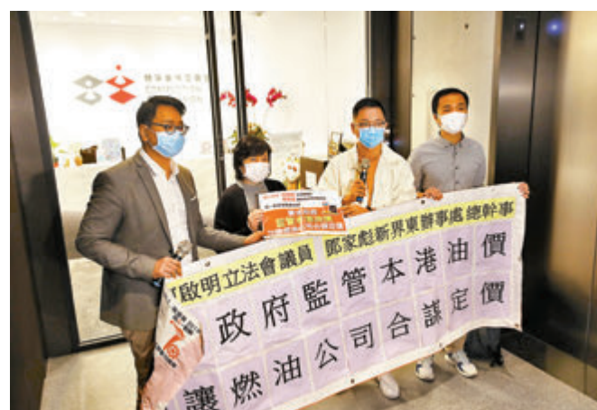
工聯會成員昨日到競爭事務委員會請願，促請徹查燃油公司有否合謀定價。