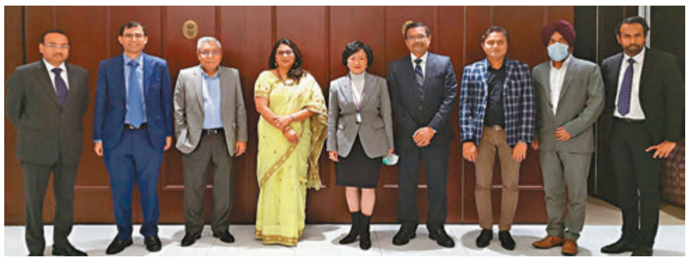
葉劉淑儀約見印度駐港總領事韓慧儀。

對有住客投訴飲食安排等程序混亂,徐德義承認酒店安排流程一開始可能較不順暢,希望盡快改善,亦明白住客有溝通需要,部分旅客因為心急想知道檢測結果,違反規定離開房間,到大堂向酒店人員查詢。「理解他們有需要同外界溝通,但希望旅客能夠留在酒店房間,透過電話查詢,日後運作較順暢時,住客留在酒店房內即可得到需要的物品和資訊。」