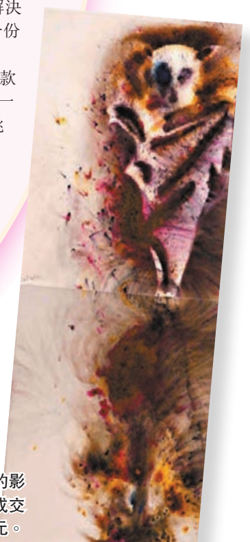
■蔡國強《蝙蝠的影子》位列第三，成交價為人民幣98萬元。