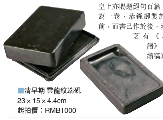
■清早期雲龍紋端硯 23 x 15 x 4.4cm 起拍價：RMB1000

鄭一桂者，乃清代官員，亦是畫家，字原襄，號小山，又號讓卿，晚號二知老人，江蘇無錫人。雍正五年二甲第一名進士，授翰林院編修。歷官雲南道監察御史、貴州學政、太常寺少卿、大理寺卿、禮部侍郎，官至內閣學士。擅畫花卉，學揮壽平畫法，風格清秀。曾作《百花卷》，每種賦詩，一經進呈，皇上亦賜題絕句百篇，一桂複寫一卷，恭錄御製於每種之前，而書已作於後，藏於家。著有《小山畫譜》、《大雅續稿》。