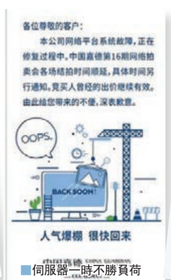
■伺服器一時不勝負荷