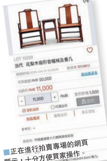
■正在進行拍賣專場的網頁顯示，十分方便買家操作。

作為最早上線網絡拍賣的拍賣公司之一，嘉德至今仍是為數不多的擁有自主獨立網絡拍賣系統的拍賣公司，在之前幾年線下拍賣市場勢頭正夯時，建設網絡拍賣系統也是拍賣公司排兵佈陣的先驗性實驗：線上拍品選件如何與傳統大拍區分、訂價特點、展示方式、線上組織，都是需要時間進行摸索與經驗總結。例如古玩瓷器雜項板塊，藏家在參與競標前往往需要看到實物，憑借輔助工具細看，方才決