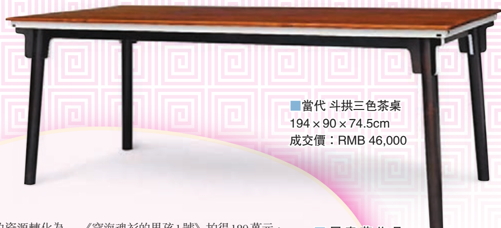
■當代斗拱三色茶桌 194 x 90 x 74.5cm 成交價：RMB 46,000