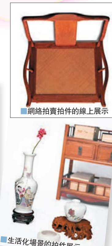
■網絡拍賣拍件的線上展示