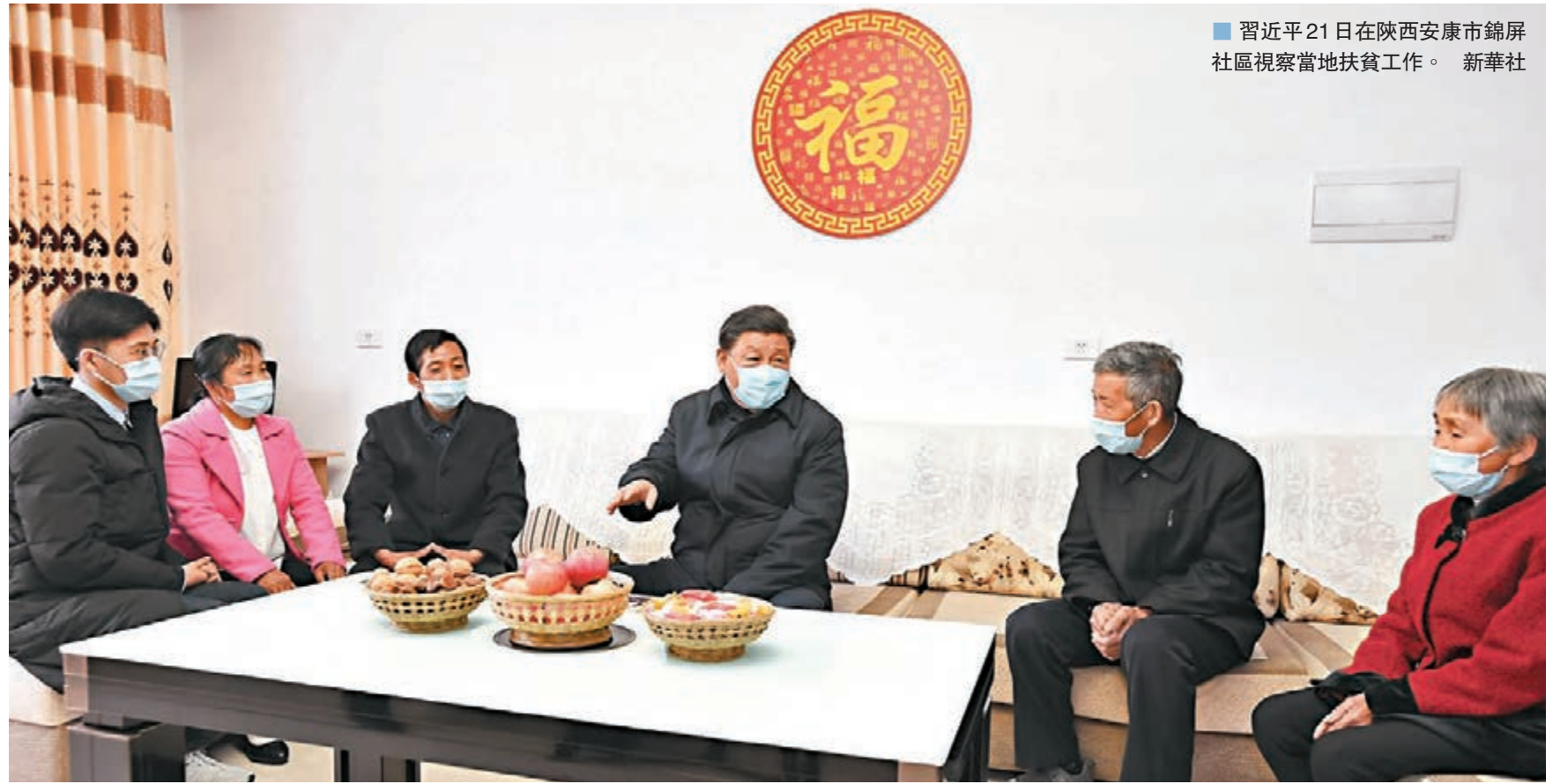
習近平21日在陝西安康市錦屏社區視察當地扶貧工作。新華社

同日上午，習近平到平利縣女媧鳳凰茶業現代示範園區考察調研，察看茶園種植情況，與現場茶農親切交流。習近平說：「因茶致富，因茶興業，能夠在這裡脫貧奔小康，做好這些事情，把茶葉這個產業做好。」