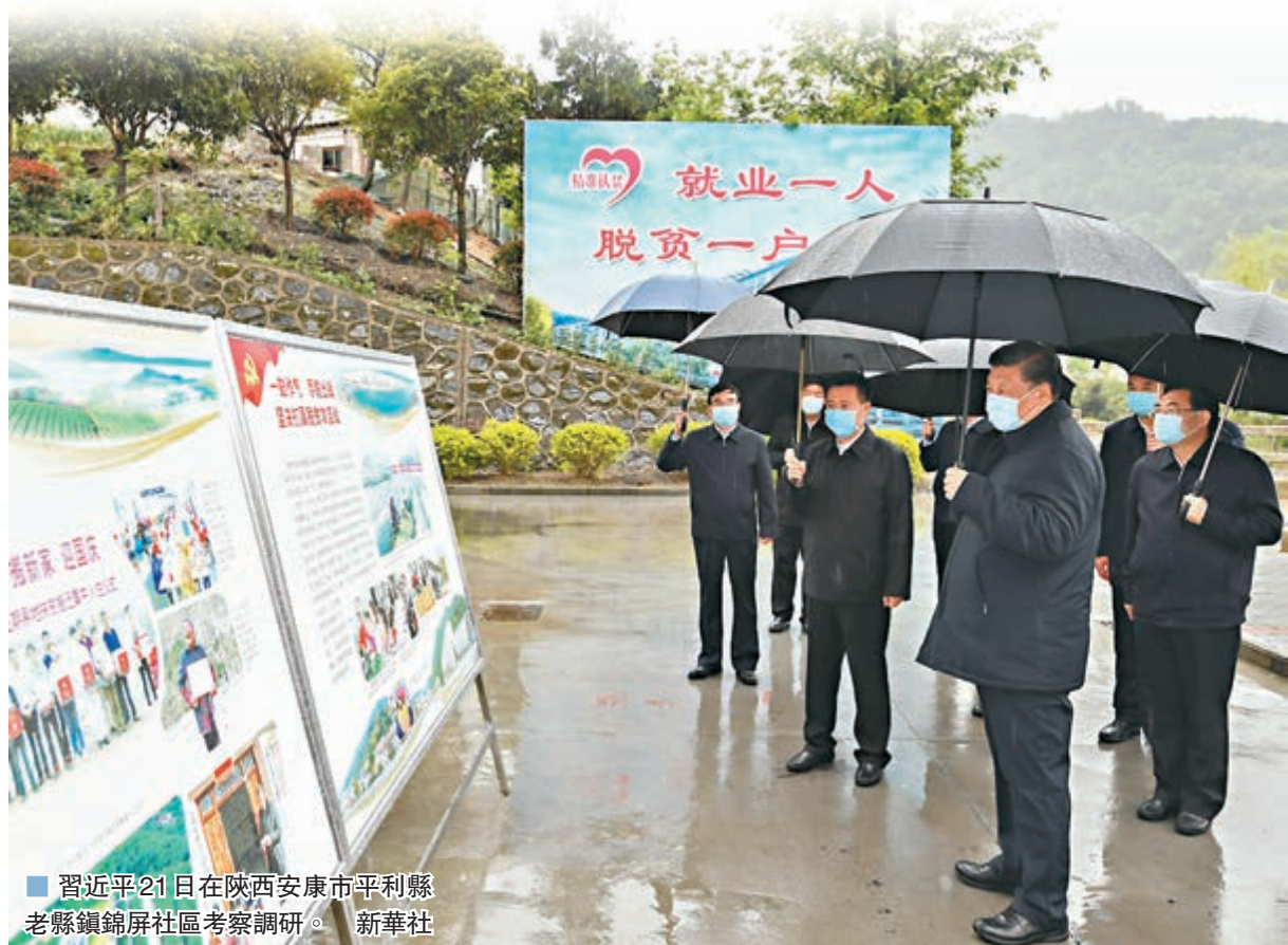
習近平21日在陝西安康市平利縣老縣鎮錦屏社區考察調研。新華社

據悉，截至2020年2月，陝西56個貧困縣（區）全部實現「脫貧摘帽」，全省易地扶貧搬遷安置房建設任務全部完成，入住率達到90%以上，易地扶貧搬遷工作取得了重大進展。全省貧困人口從2011年年底的592萬減少到2019年年底18.34萬人，貧困發生率由21.40%降到0.75%，區域性整體貧困基本解決。 ■香港文匯報記者 李陽波 陝西報道