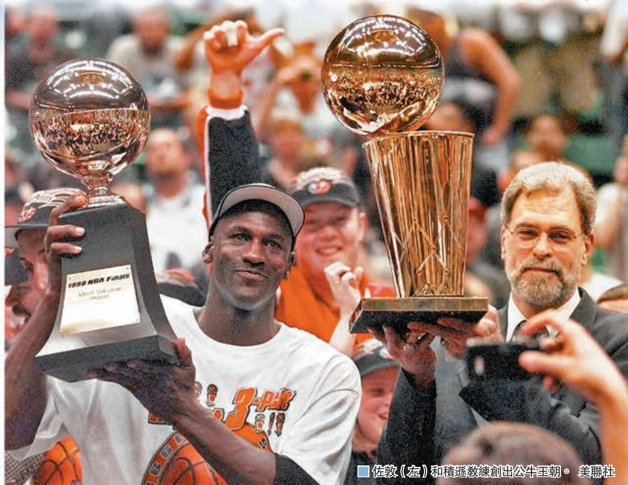
佐敦(左)和積遜教練創出公牛王朝。

至於第2集節目，主角則是佐敦的好拍檔、「二哥」柏賓；這位球隊最強「綠葉」一直在佐敦身後作輔助，但由於他在1991年時已簽下一紙7年長約，故薪金和佐敦差天共地，每季只有277萬美元的薪酬，但柏賓卻未有因此放軟手腳，專業精神值得敬重。