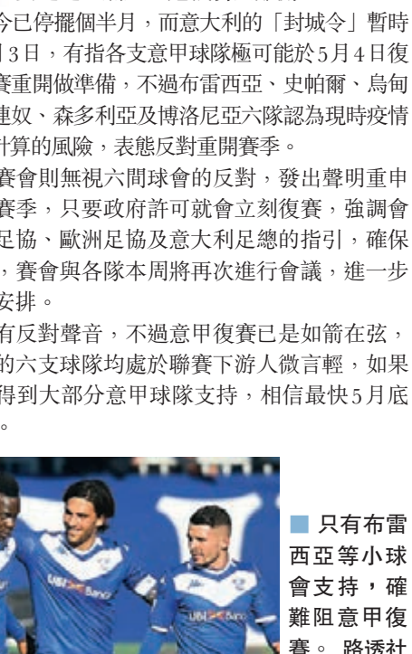
只有布雷西亞等小球隊支持，確難阻意甲復賽。