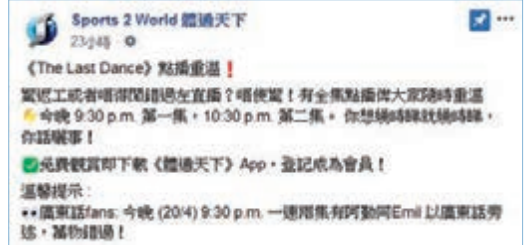
球迷可從體通天下平台觀看。