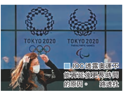
IOC透露奧運不能再推遲更長時間的原因。

所有的夥伴、贊助商、當地政府都需要整合。推遲(奧運會)涉及各方的限制和妥協。推遲沒有藍圖，但是國際奧委會相信所有複雜的部分將最終捏合起來，給我們帶來一屆偉大的奧運會。」