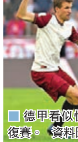
德甲看似快將復賽。資料圖片

施潘表示：「綜合考慮當前疫情態勢，德甲恢復以閉門方式作賽是可行的。關鍵是如何將感染風險降到最低。」