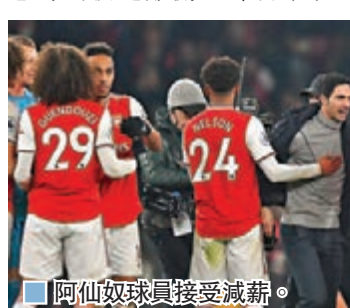
阿仙奴球員接受減薪。

阿仙奴在官網發佈聲明稱，他們與一線隊球員、主帥以及教練組核心成員達成了「自願協議」，以幫助球會在這個危急時刻渡過難關。聲明中表示