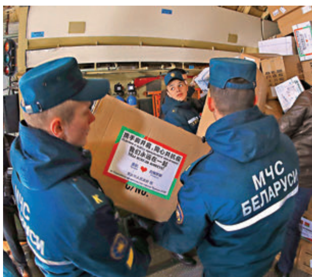
中國向白俄羅斯援助防疫物資。資料圖片