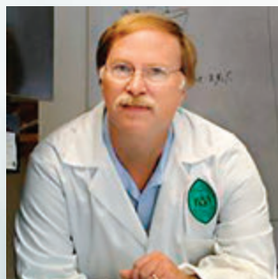
加里教授