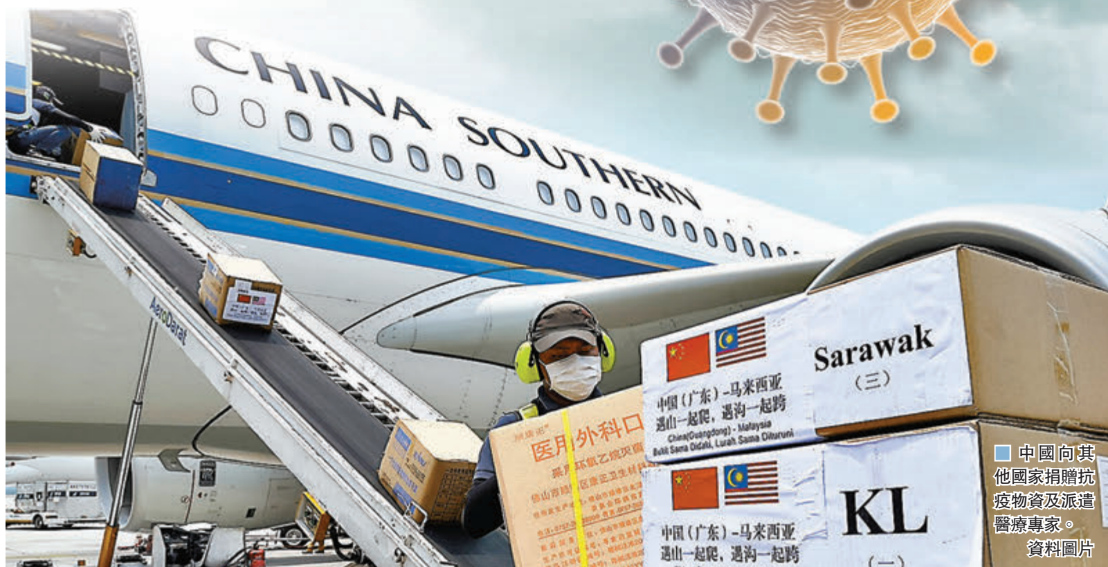
中國向其他國家捐贈防疫物資及派遣醫療專家。資料圖片