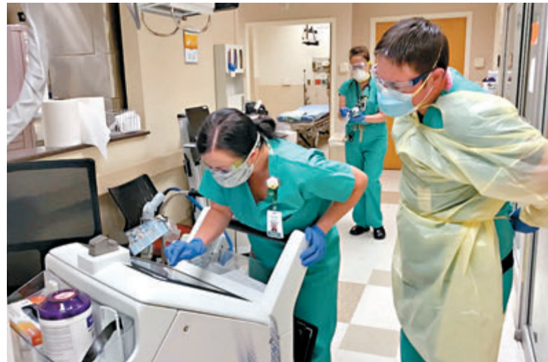
杜蘭大學醫療人員檢測新冠病毒。網上圖片