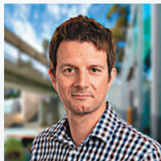
安德森助理教授

防疫專家同樣指出新冠病毒不是源自於「武漢實驗室」，美國國家過敏與傳染病研究院(NIAID)主任福奇上周五回應時，同樣引述斯克里斯普斯研究院的研究，指出將新冠病毒的基因序列與蝙蝠身上冠狀病毒對比後，明確顯示新冠病毒是由動物傳染人類。世界衛生組織的西太平洋區主任葛西健昨日亦在記者會提到，現階段要確定新冠病毒來源為時尚早，又認為現有證據顯示病毒是來自於動物。