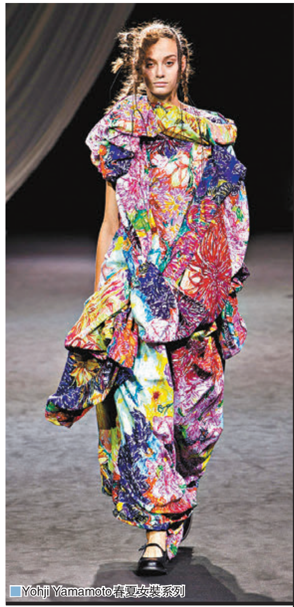
Yohji Yamamoto 春夏女裝系列

今年是充滿挑戰的一年，現在大家不能旅遊，幸而近年有不少日本時裝品牌進駐香港開設新店，讓港人在香港也可以直接購買日本潮流時裝，當中的時裝千變萬化，款式時尚、設計獨特，甚至男裝女着於今個春夏再度流行起來，令寬鬆型格不只是男生獨有，讓女生也可輕鬆配搭出不同造型，展現個性。