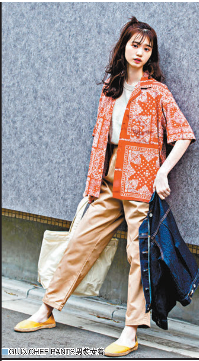
GUI CHEF PANTS 男裝女着