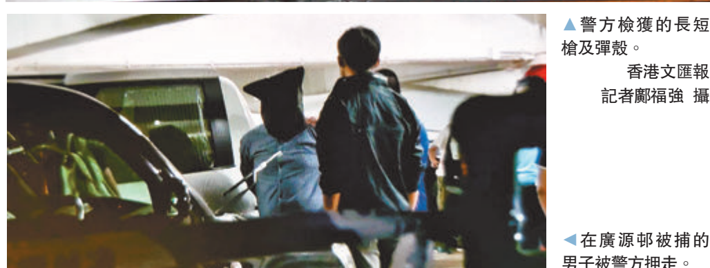
▲在廣源邨被捕的男子被警方押走。