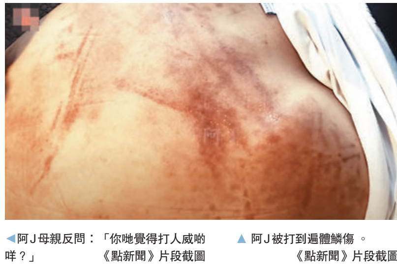
▲阿J被打到遍體鱗傷。