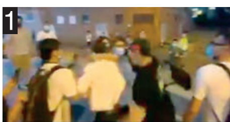
1 黑男從後拳毆保安員。