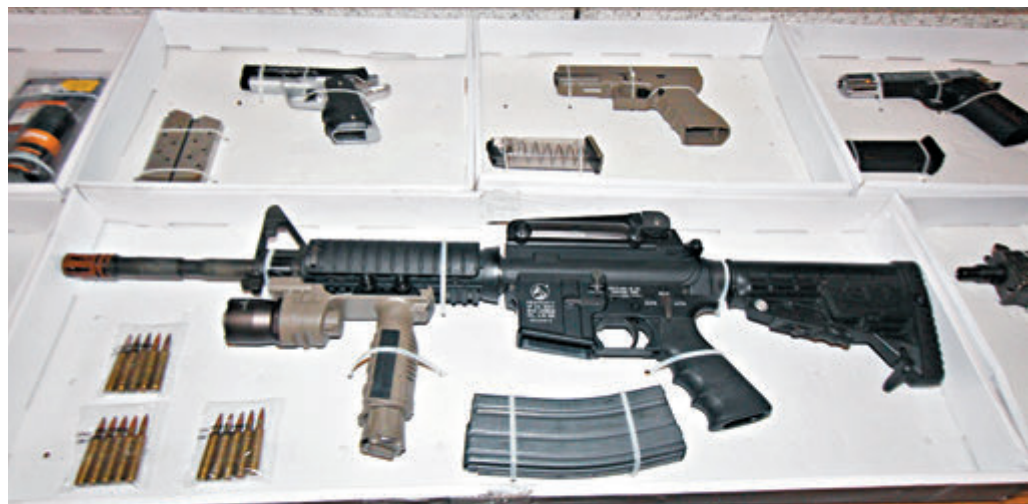
▲警方檢獲的長短槍及彈殼。