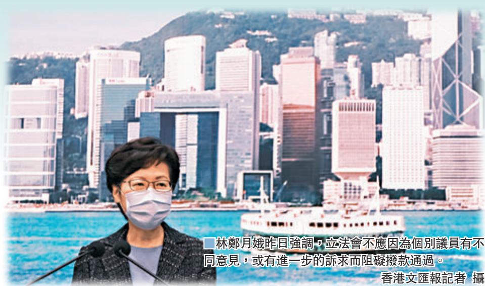
林鄭月娥昨日強調，立法會不應因為個別議員有不同意見，或有進一步的訴求而阻礙撥款通過。

林鄭月娥在出席行政會議前會見傳媒的開場發言中表示，非常感謝財委會於上星期通過了「防疫抗疫基金」第二輪和其他項目的撥款，令特區政府可以盡快落實涉及1,375億元的「保就業」、「撐企業」、「紓民困」的措施。前日，她已經和司局長初步檢視過這30多個項目，至少有七成的措施已經可以馬上接受申請或毋須申請便可以為合資格的企業或個人提供支援，並會再探討不多於10個項目的細節上有否優化空間。 她有感而發道，正如在財委會會議上41名支持撥款的建制派議員指出，這批項目是「及時雨」，立法會是不應該因為個別議員有不同意見或有進一步的訴求而阻礙撥款通過。「大家可以想像，如果今日的立法會是由向這1,300多