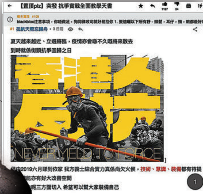
▲網上討論區「連登」就有網名「孤帆天際忘歸舟」者發佈所謂「抗爭實戰全面教學天書」。

他強調，泛暴派區議員損害區議會的聲譽，應褫奪其區議員的資格，執法部門應主動介入，展開徹底調查，盡快將有關人等繩之以法，接受法律的制裁。