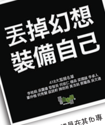
▲兩名泛暴區議員在其fb專頁上煽動「勇武」再戰。