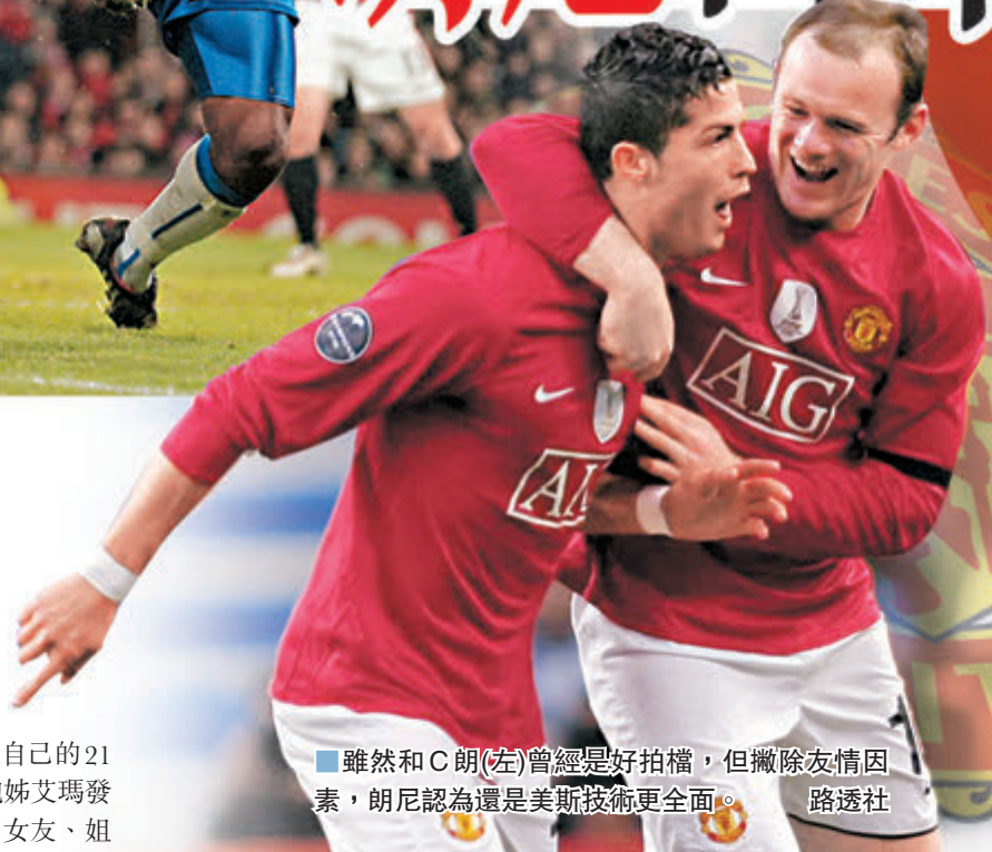
雖然和C朗(左)曾經是好拍檔，但撇除友情因素，朗尼認為還是美斯技術更全面。

朗尼於《The Times》的專欄中談到自己的職業足球生涯，雖然為曼聯上陣559次射入253球，是球隊入球紀錄保持者，並於英格蘭代表隊以53球超越了卜比查爾頓的最多「士哥」紀錄，但朗尼卻指自己不像前輩連尼加或舊拍檔雲尼杜萊般，是一位天生的射手，還預期熱刺中鋒哈利卡