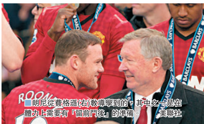
朗尼從費格遜(右)教導學到的，其中之一是宿體力上需要「留門後」的準備。

朗尼於《The Times》的專欄中談到自己的職業足球生涯，雖然為曼聯上陣559次射入253球，是球隊入球紀錄保持者，並於英格蘭代表隊以53球超越了卜比查爾頓的最多「士哥」紀錄，但朗尼卻指自己不像前輩連尼加或舊拍檔雲尼杜萊般，是一位天生的射手，還預期熱刺中鋒哈利卡