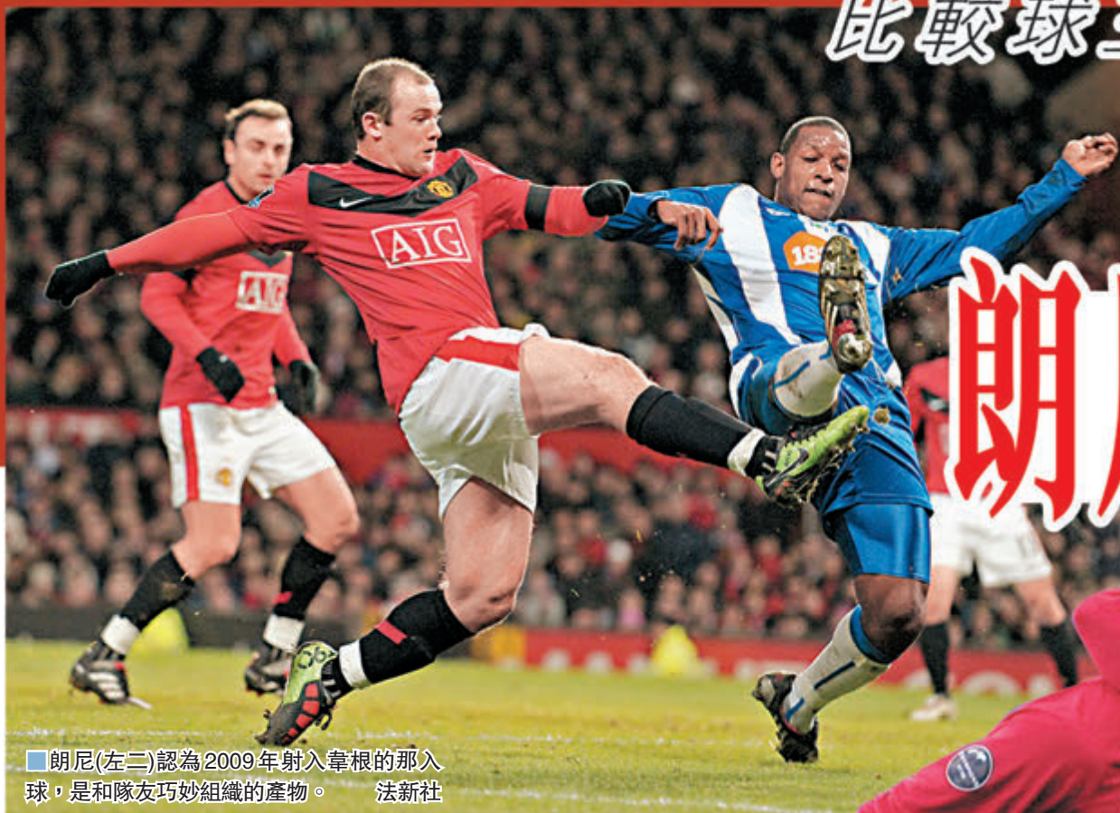
朗尼(左二)認為2009年射入韋根的那入球，是和隊友巧妙組織的產物。

英格蘭射手朗尼在職業生涯入球數以百計，究竟哪個才是他心中最愛之「金球」？這位前曼聯球星日前在自己的專欄中就表示，雖然大家均很喜愛他對曼城時射入的「倒掛金鉤」，但其實對韋根的一個有組織入球，才是他心中「至愛」。