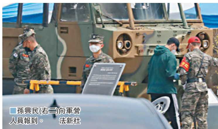
孫興民(右二)向軍管人員報到。

香港文匯報訊（記者 楊浩然）早前傳出會借英超疫情停戰的空檔，回韓國接受3周軍事訓練的熱刺射手孫興民，昨日正式抵達軍營報到，據報這位韓國國腳將會面對十分艱苦的訓練。當地媒體報道，孫興民昨日抵達位於濟州島的海軍陸戰隊營地報到，他穿着綠色的夾克，戴着黑色棒球帽並戴上了口罩。由於在2018年協助韓國隊贏得亞運會金