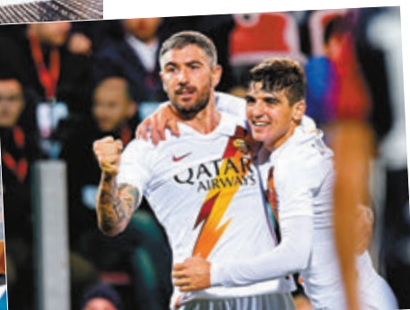
羅馬高層與職球員齊心共度時艱。

另一方面，羅馬職球員則決定和球會共度時艱；該支意甲勁旅日前宣佈，球員、教練組以及工作人員均願意放棄本季度的薪水。聲明表示：「球會所有球員、主教練和他的團隊將放棄4個月的薪水，幫助球隊應對疫情。這次行動證明球隊上下有多團結，球員和教練都做出了表率。」羅馬的管理層亦證實已放棄一定比例的薪水。