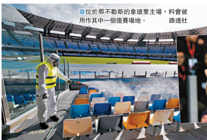
位於那不勒斯的拿波里主場，料會被用作其中一個復賽場地。

從球員的舉動亦可看到有關方面的確有復賽的決心，例如祖雲達斯中場比真歷、國際米蘭翼鋒阿歷斯山齊士，據報和早前AC米蘭一眾外援一樣，已被要求返回意大利並先接受14日隔離，一切明顯均為