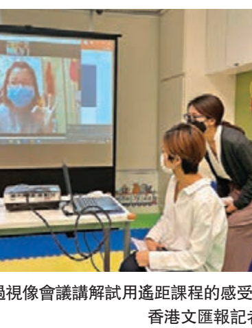
■陳太透過視像會議講解試用遙距課程的感受。