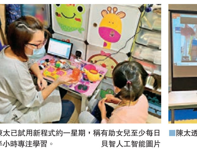
■陳太已試用新程式約一星期，稱有助女兒至少每日有半小時專注學習。

中學校長會料文憑試開考後商復課 香港文匯報訊（記者 高鈺）隨着本地疫情放緩，即將於本週五開考的文憑試（DSE）及未來復課安排成為學界關注焦點。中學校長會主席鄧振強指，近日各學校教職員有持續做準備，估計順利開考後，教育局便會與學界商討復課方案。他又建議當局可考慮將大學原用於招收非本地生的學額，撥出一半予港生升學，讓他們對前景較安心。 鄧振強昨出席電台節目時指，教育局與學界就文憑試方案一直有緊密商討，而香港至今沒有涉及學生群聚的確診個案，反映港生自我保護意識高，是相對安全的群體，認為在學界全力做好準備下，考試應可順利進行。 他又表示，早前曾向當局建議，將大學原供錄取非本地生的3,000個額外學額，調配一半予受疫情影響的港生，讓他們減少因成績下降1級、2級而考不上大學，可以更為安心。教育局回覆傳媒時指，收生屬院校自主事宜，不過現時各大學以額外學額錄取非本地生，是以收回成本為原則，收取高於港生的學費，兩者情況不可相提並論。資料顯示，現時8大非本地生每年學費約12萬元至17萬元，是港生的3倍至4倍。 至於復課事宜，教育局早前已預計會分階段讓高年級先上課半天，鄧振強表示，不少學校擔心停課太久對各級學生有不良影響，期望文憑試開考後與教育界商討復課方案，助學生返回有規律的學習模式。津中議會執委林日豐認為，復課準備較文憑試複雜，希望當局於衛生管理和人群控制上向學校提供指引，亦要關注學生心理上是否準備好。