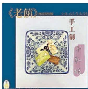
▲相關「黃店」以「手足」製作烏結糖作賣點。