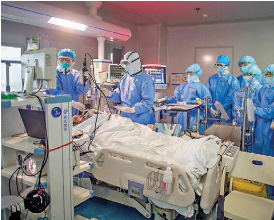
張繼先最早判斷並堅持上報新冠病毒感染的肺炎疫情，第一個為疫情防控工作拉響警報。圖為武漢肺科醫院的醫生在救治患者。

2019年12月26日至29日，湖北省中西醫結合醫院呼吸內科主任張繼先，先後接診發現7例不明原因肺炎病例。她憑着超強的專業敏感意識，最早判斷並堅持上報新冠病毒感染的肺炎疫情，第一個為疫情防控工作拉響警報。今年2月，她與金銀潭醫院院長張定宇一起被湖北省給予記大功獎勵。