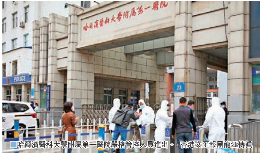
哈爾濱醫科大學附屬第一醫院嚴格管控人員進出。

香港文匯報訊（記者 王欣欣 哈爾濱報道）哈爾濱市4月9日通報新增本土新冠肺炎確診病例1例和無症狀感染者3例，打破了該省29天本土無新增確診病例的紀錄。自此開始，這條病毒傳染鏈持續延長。截至發稿，因該市未公佈4月18日新增4例確診病例的軌跡，故截至4月17日24時，該病毒傳染鏈已導致哈爾濱市50人感染（包括18例無症狀感染者）。這