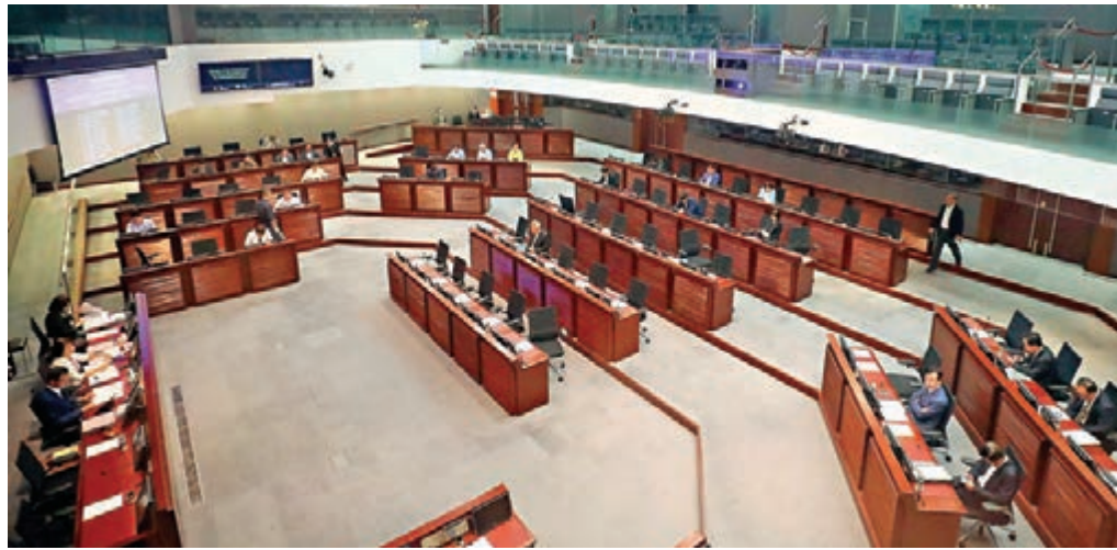
反對派議員拉布阻撓，內會至今仍未選出正副主席。