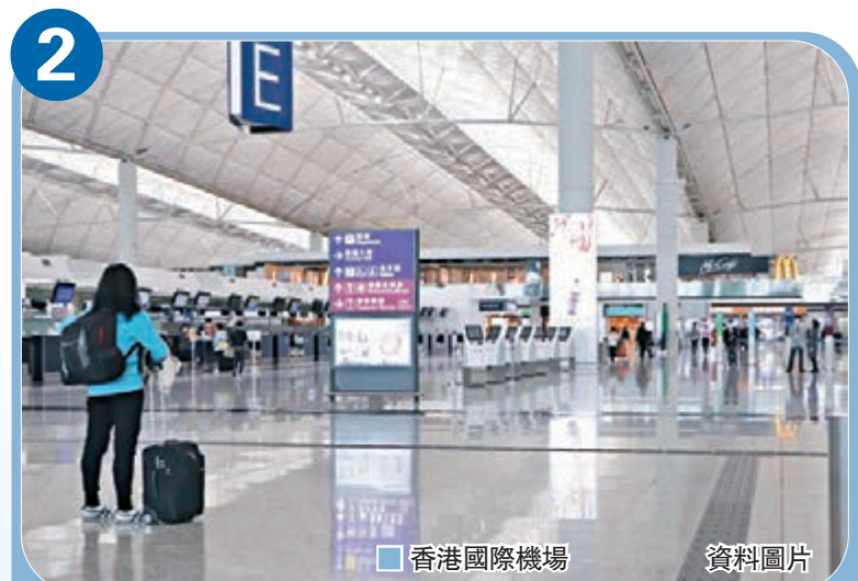
香港國際機場 資料圖片

衛生署今日起則會為從機場入境人士提供多一個深喉唾液樣本瓶,張竹君指入境人士要在為期14天檢疫期內的第十二天再次採樣,並交回樣本至收集站,衛生署正常情況下會在翌日早上進行化驗,即晚便會有結果。