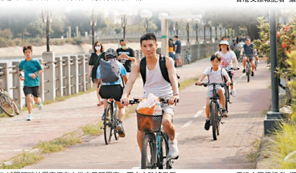
城門河畔的單車徑有大批市民踩單車,不少人除掉口罩。