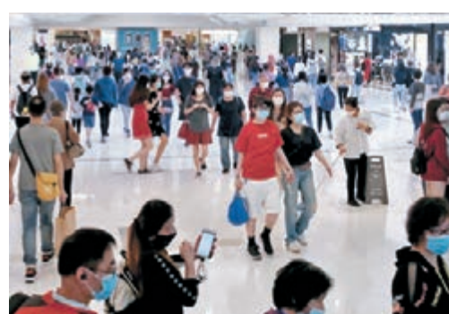
沙田新城市廣場昨日人頭湧湧。

除單車徑外,昨亦有不少市民到沙田新城市廣場購物及用膳,當地食肆出現排隊入座情況。另外,尖沙咀海濱也有不少遊人,有外傭周日續相約聚會,但聚集人數眾多,遠超過「限聚令」規定不多於4人聚集的人數。