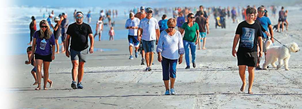
佛州沙灘在解封後迅即出現人潮。