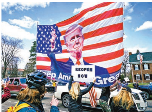
特粉順帶為特朗普連任造勢。

美國總統特朗普無視國內疫情仍然嚴重，執意提前解除居家令，前日更公然煽動支持者，針對反對過早解封的民主黨籍州長示威，號召他們「解放」這些拒絕解封的州份，試圖以「群眾鬥州長」的手段達到政治目的，並將抗疫不力損害經濟的責任轉嫁到民主黨人身上。一眾州長炮轟特朗普煽動民眾參與非法行動，警告此舉將數以百萬計國民的性命置於危險境地。