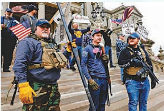
右翼團體帶同槍械參與示威。

特朗普前日在twitter連發3條帖文，以大楷字母煽動支持者「解放」(LIBERATE)明尼蘇達州、密歇根州及弗吉尼亞州，並呼籲支持者捍衛憲法第二修正案賦予的擁槍權，反對弗吉尼亞州政府收緊槍械管制。他又點名批評民主黨籍紐約州州長科莫，不滿對方多番批評華府的防疫措施，「科莫應該花更多時間『做事』，花少些時間『投訴』。」