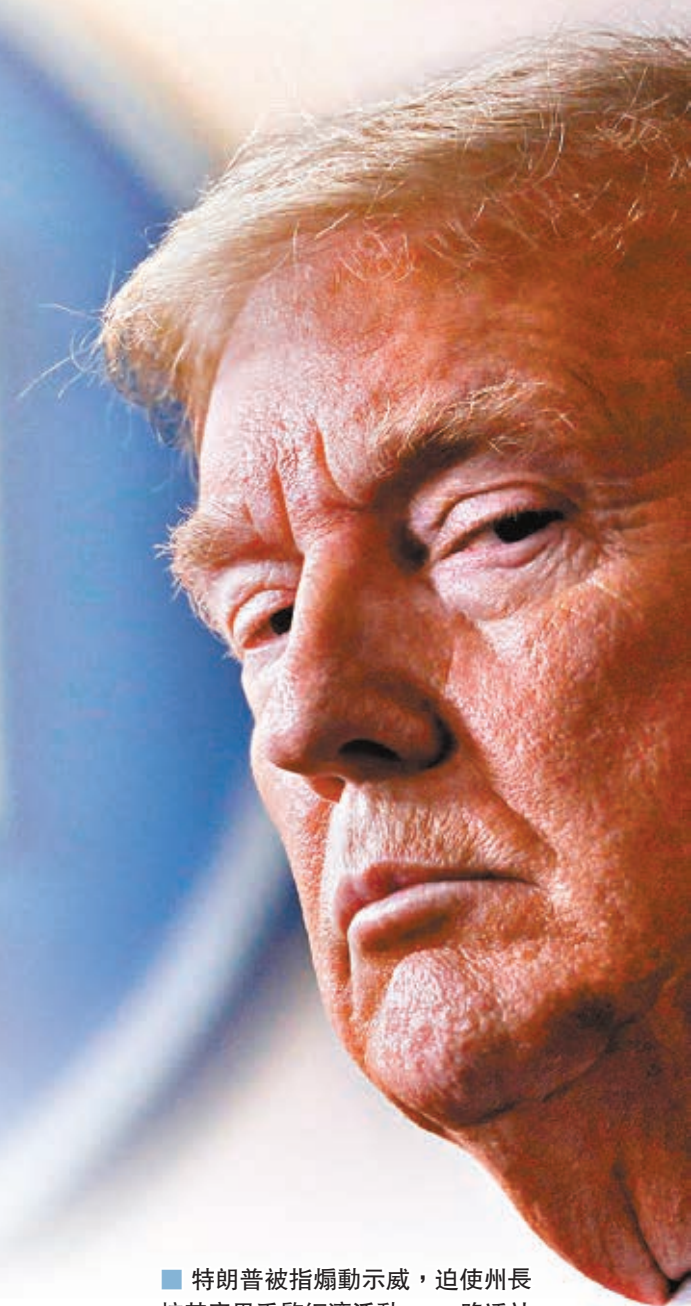
特朗普被指煽動示威，迫使州長按其意思重啟經濟活動。