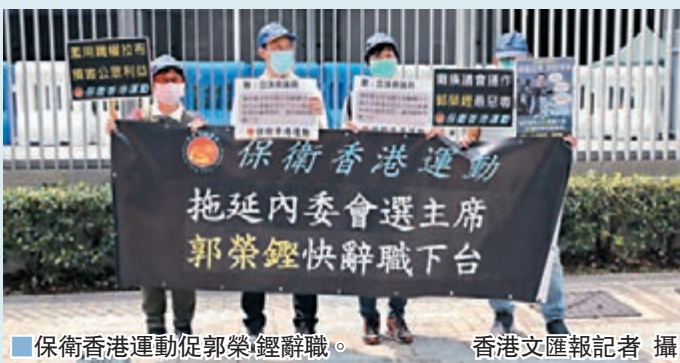
保衛香港運動促郭榮鏗辭職。香港文匯報記者 攝

香港文匯報訊（記者 子京）公民黨立法會議員郭榮鏗濫權，令立法會內務委員會經過第十五次會議後仍未能選出內會主席。政黨、團體和市民昨日先後到政府總部及律政司外集會請願，強烈譴責郭榮鏗惡意拉布，倒行逆施和罔顧民生，要求律政司依法將之DQ。