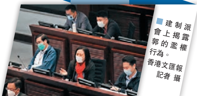
建制派會上揭露郭的濫權行為。