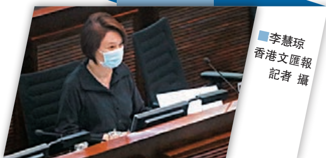
李慧琼香港文匯報記者 攝