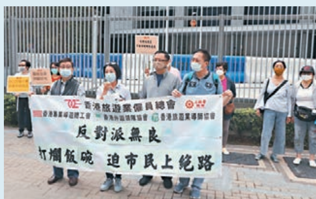
工聯會屬會香港旅遊業僱員總會等，在政府總部外抗議反對派打爛飯碗，迫市民上絕路。

他點名批評反對派立法會議員朱凱迪日前發表所謂「司機和導遊無端端受到特別照顧」的言論，是對業界從業員赤裸裸的歧視及打壓，要求朱凱迪收回言論及道歉。