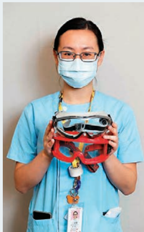
江嘉愉加入Dirty Team，獲父親送贈護目鏡「加持」。