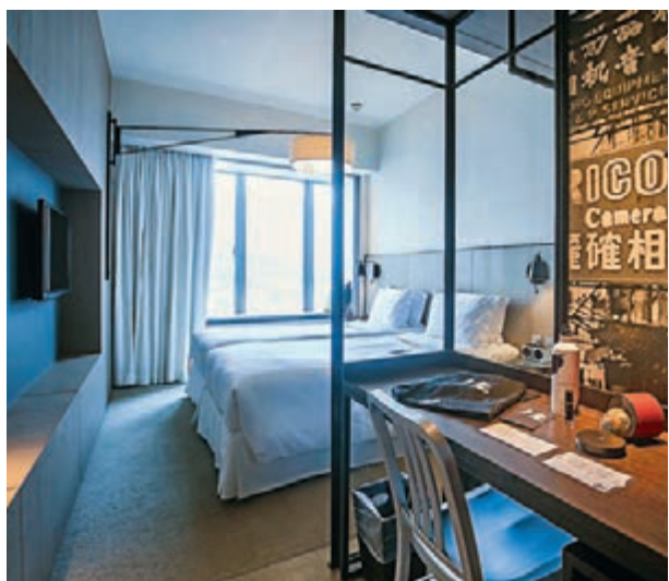
九龍貝爾特酒店為前線醫護提供免費住宿，可服務約300人。

香港文匯報訊（記者 梁悅琴）新世界發展昨日公佈，旗下九龍貝爾特酒店為醫管局前線醫護提供免費住宿，預留約一半房間可同時服務約300人，入住長短視乎疫情發展。酒店發言人接受香港文匯報記者查詢時表示，昨日開始接受醫護人員登記，料今天有醫護免費入住。