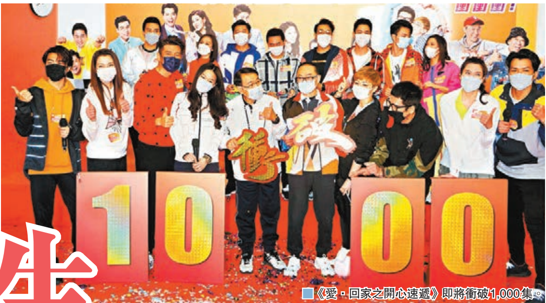
《愛，回家之開心速遞》即將衝破1,000集。