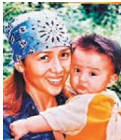
光希讚媽媽是：「the best mum in the world！」