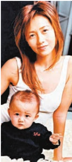
心美也晒出小時候的母女合影。