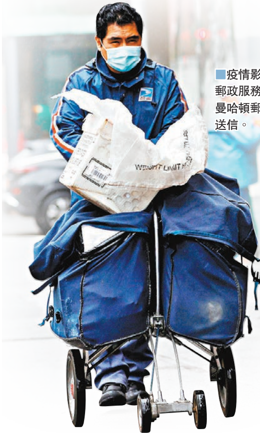
疫情影响多地郵政服務。圖為曼哈頓郵差冒雨送信。