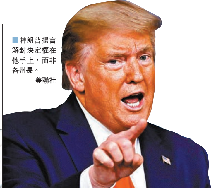
特朗普揚言解封決定權在他手上，而非各州長。