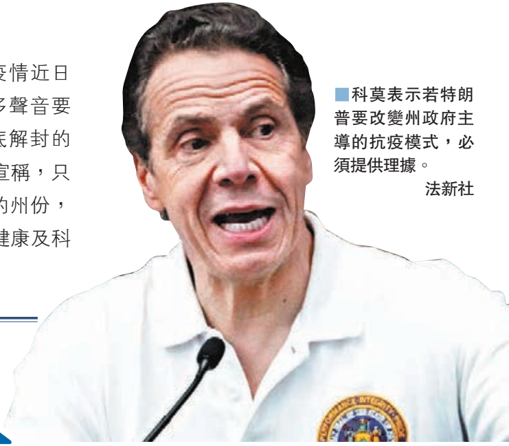
科莫表示若特朗普要改變州政府主導的抗疫模式，必須提供理據。