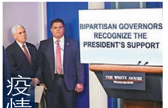
特朗普播片稱抗疫工作獲多名州長支持。

英國《衛報》則指出，特朗普先前指美國世衛撥款金額超過中國10倍，但其算法是把具強制力的年度會費與捐款加起來，然而美國目前積欠會費2億美元(約15.5億港元)，捐款也多指定特殊用途。 ■綜合報道