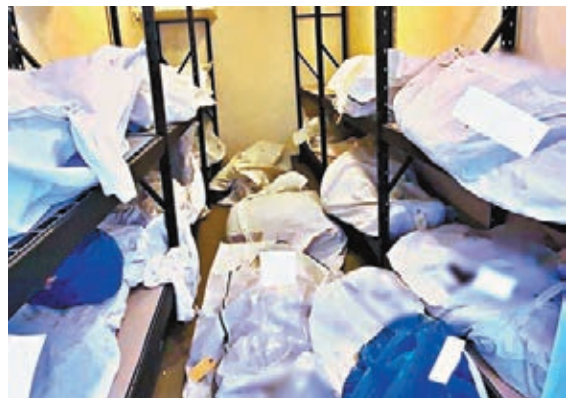
底特律有流動殮房屍疊屍。

員工解釋，照片是在本月初拍攝，有床的特殊病房平時主要用作觀察患者睡眠習慣，由於當日停屍間爆滿，不得已用作暫放遺體。員工亦提到，醫院人手、物資、停屍間長期不足，拍攝照片當日是近期最忙碌一段時間，院內同時有130名新冠肺炎患者，每12小時便有5人病逝，更有最少2名患者在急症室走廊上死亡。