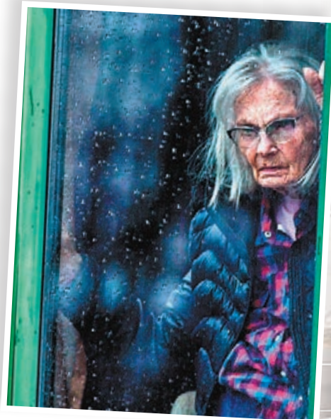
魁北克省護老院的長者在凝望窗外景物。

在美國方面，全國的護老院和長期護理機構中，有超過3,300名患者的死亡與疫情有關。美國疾控中心表示，新冠肺炎死者有80%是65歲以上長者。專家表示，新冠病毒相關的實際死亡病例可能更多，因為不少人在病逝前未接受病毒檢測，使大多數州的統計數據有偏差。