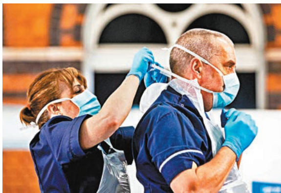
英國嚴重缺乏保護衣。網上圖片

英國的新冠肺炎疫情仍未見頂，醫護個人防護裝備短缺問題愈趨嚴重，當地政府最新數據顯示，已接受新冠病毒檢測的約1.7萬名國家醫療服務(NHS)員工中，多達1/3確診，比例遠高於整體人口，反映英國