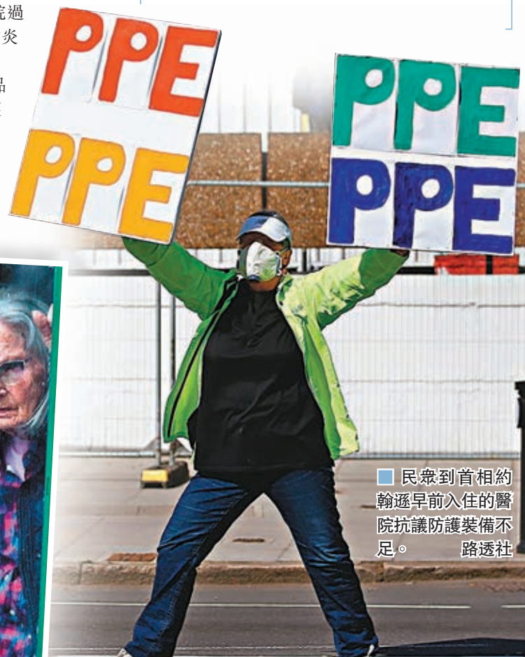
民衆到首相約翰遜早前入住的醫院抗議防護裝備不足。