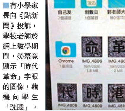
■有小學家長向《點新聞》投訴，學校老師於網上教學期間，螢幕竟顯示「時代革命」字眼的圖像，藉機向學生「洗腦」。

她批評，縱容助長了此等「歪風邪氣」，希望教育局及學校能夠正視問題所在，讓政治絕跡於校園。