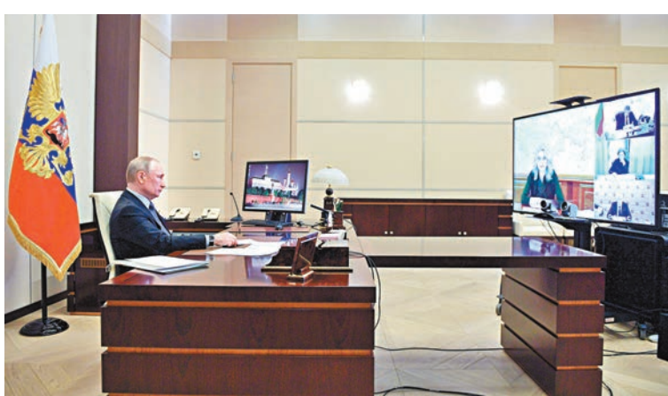
普京通過視頻會議了解疫情發展。