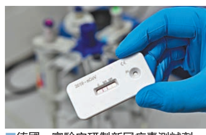
德國一實驗室研製新冠病毒測試劑。

世衛前日表示，新型冠狀病毒比2009年全球大流行的甲型H1N1流感病毒還要致命10倍，強調必須要有疫苗才能完全阻斷傳播。 世衛表示，甲型H1N1流感是2009年3月在墨西哥與美國首度發現，造成1.85萬人死亡，但《刺針》醫學期刊估計，當年疫情總死亡人數介於15萬至57萬之間。 甲型H1N1流感在2009年6月宣告為全球大流行，在2010年8月結束，結果沒有一開始預期的致命。當時全球各國趕緊研發疫苗，但在西方國家，