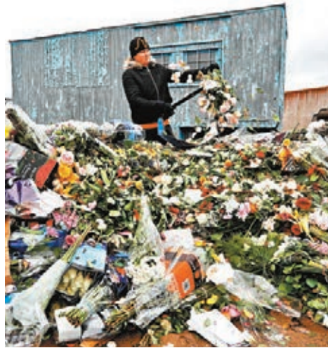
花商銷毀大量玫瑰花。