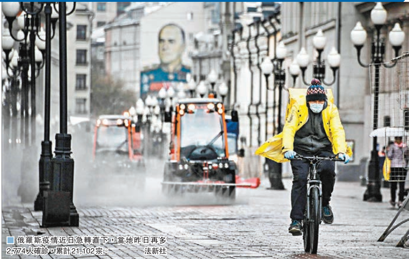
俄羅斯疫情近日急轉直下，當地昨日再增2,774人確診，累計21,102宗。