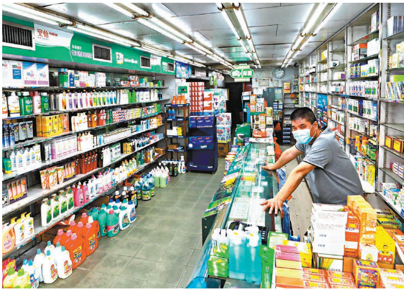
市道不景令不少商店瀕臨結業，政府推出「保就業計劃」希望減輕僱主負擔。