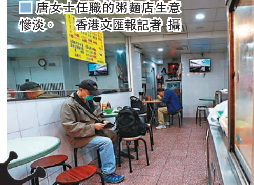
■ 唐女士任職的粥麵店生意慘淡。

郭宏興指業界面對的情況極為嚴峻，擔心拉布使不少食肆未等到防疫抗疫基金批出的資助就已經結業，「希望立法會可以順利批出撥款，如果有人以拉布等方式阻撓撥款，簡直是喪盡天良。」