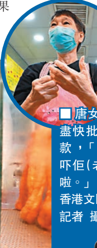
■ 唐女士盼盡快批出撥款，「幫吓吓佢（老闆）啦。」