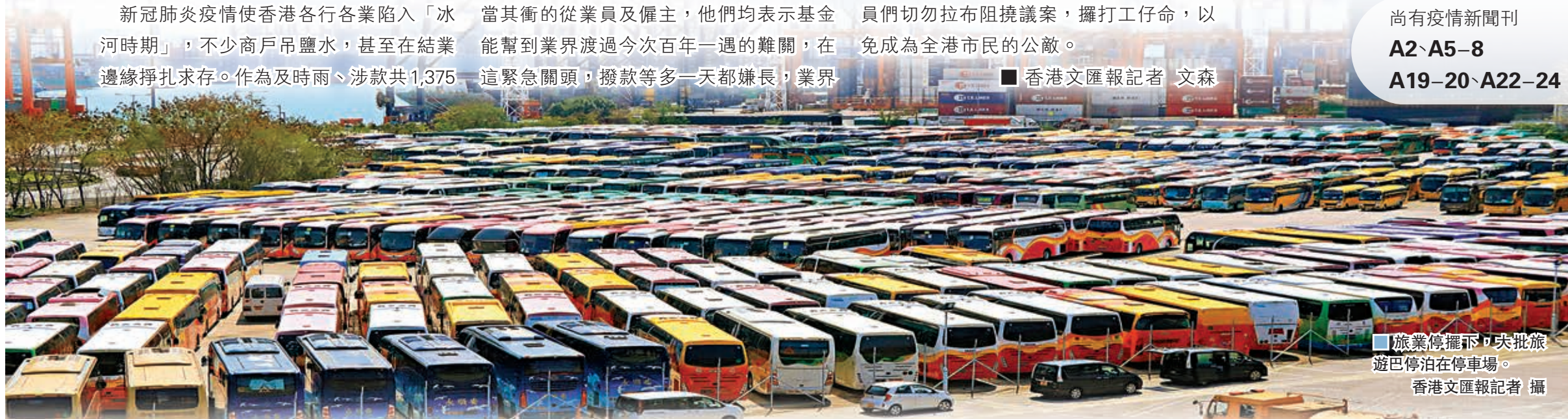
尚有疫情新聞刊 A2、A5-8 A19-20、A22-24