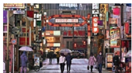
東京民眾路過歌舞伎町附近。

日本東京都昨日新增197宗新冠肺炎病例，連續4天錄得新高，都內感染者累計1,902人。首相安倍晉三表示，為防新冠肺炎蔓延，計劃要求民眾避免前往鬧市的要求擴大至全國，並考慮要求已發佈「緊急事態宣言」的7個都府縣各單位，將上班人數至少減7成，鼓勵在家辦公。