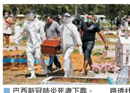
巴西新冠肺炎死者下葬。