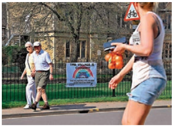
英國疫情未到達高峰期，將繼續實施封城。