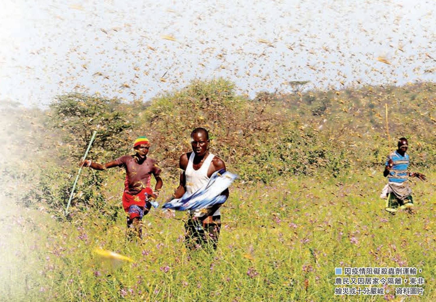
因疫情阻礙殺蟲劑運輸，農民又因居家令隔離，東非蝗災或十分嚴峻。 資料圖片