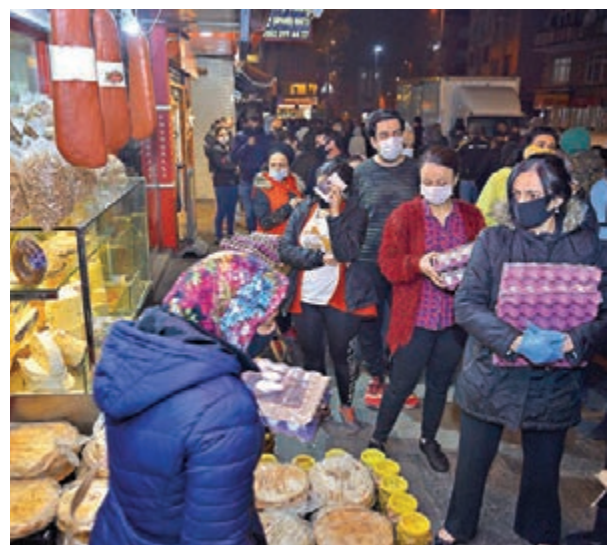
伊斯坦布爾民眾連夜排隊購買食物。

土耳其的新冠肺炎急劇惡化，內政前日突然宣佈，自當地時間前日午夜起對31個省份頒佈48小時「禁足令」，影響全國78%人口，合共約6,400萬人。由於政府僅在禁令生效前兩小時及無預警下作出公佈，不少居民得悉後紛紛搶購食品，引發混亂場面，其間有人大打出手，一名男子遭人揮刀刺傷。