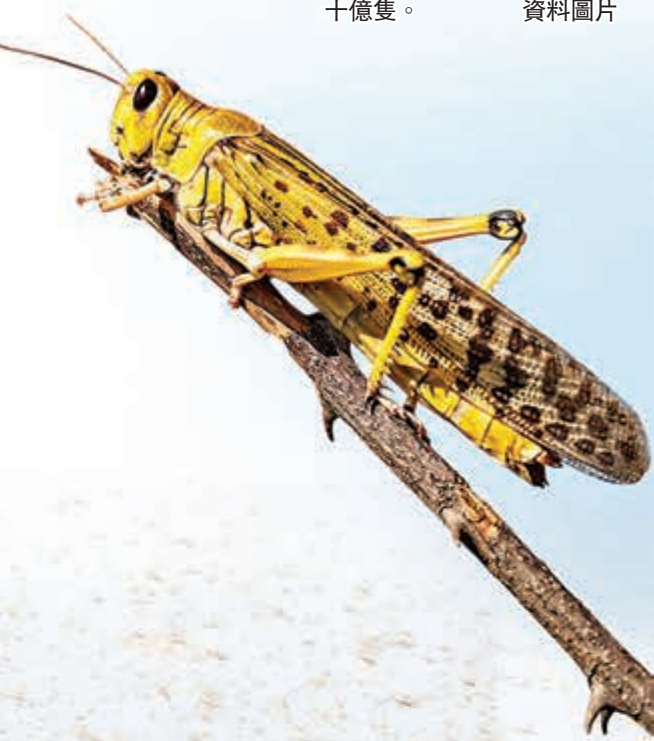
東非新一波蝗災料達數十億隻。 資料圖片