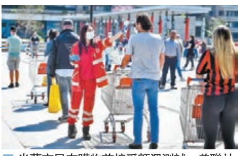
米蘭市民在購物前接受額溫測試。

反黑手黨調查員格拉泰里亦警告，一旦當局未有及時向疫區家庭提供協助，黑手黨就會乘虛而入。他形容黑手黨頭目視所在城市為自己的「領地」，認為若要管理當地，便需照顧居民，「在居民眼中，敲門帶來免費食物的黑手黨頭目是英雄，當獲得這些家庭支持後，例如當舉行選舉時，便可要求居民支持對黑手黨有利的候選人。」