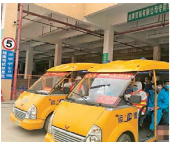
廣西憑祥執法人員準備轉運越南駕駛員到友誼關口岸。

在待排查的疑似病例81例中，80例乘坐同一航班，來自俄羅斯，10日抵達上海浦東國際機場。因有症狀，入關後即被送至指定醫療機構留觀。同航班所有乘客均已落實集中隔離觀察。