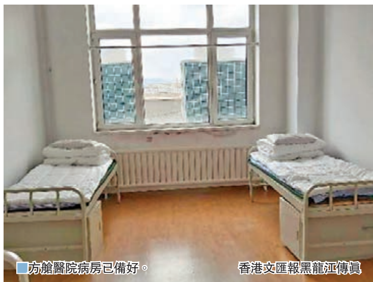
方艙醫院病房已備好。

黑龍江已統籌省、市、縣三級醫療資源，儲備了1,000人的醫療支援力量，以呼吸、重症和感染專業為主，按醫生護士40人、60人的結構比例，以100人為一個團隊，根據臨床需要分梯次整建制隨時投入救治工作。