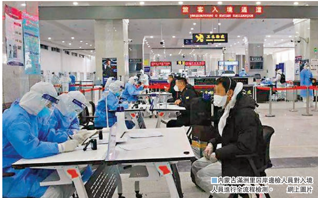
內蒙古滿洲里口岸邊檢人員對入境人員進行全流程檢測。