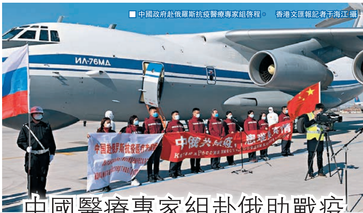
■ 中國政府赴俄羅斯抗疫醫療專家組啟程。