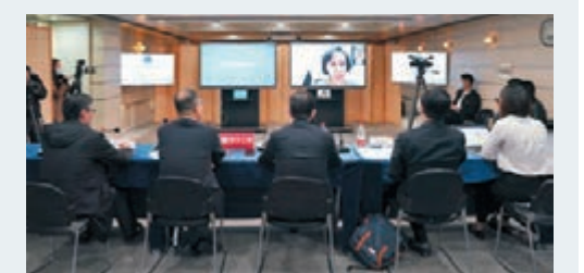
■ 埃塞俄比亞衛生部長利婭·塔德塞和中方專家交流。

3月13日，埃塞俄比亞確診了首例新冠病例。截至4月10日，該國累計確診病例達65例，其中3人死亡。