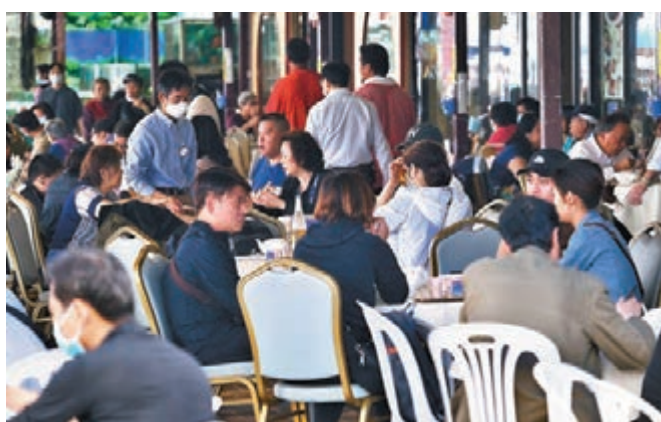
■西貢一家食肆昨日顧客爆滿，疑違反「限聚令」。

他並重申，現時要求從外地抵港人士在家居進行檢疫的安排有風險。政府雖要求入境人士抵港後立即檢測，但部分人可能較遲發病，檢測結果呈陰性亦不一定反映當事人未有染疫，他們在家中檢疫有機會令病毒經家人傳入社區，故再呼籲政府物色集中檢疫設施讓入境人士入住。