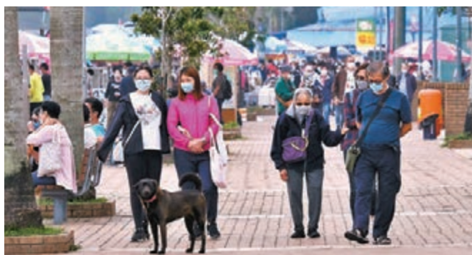
■西貢街頭昨日遊人如鯽。