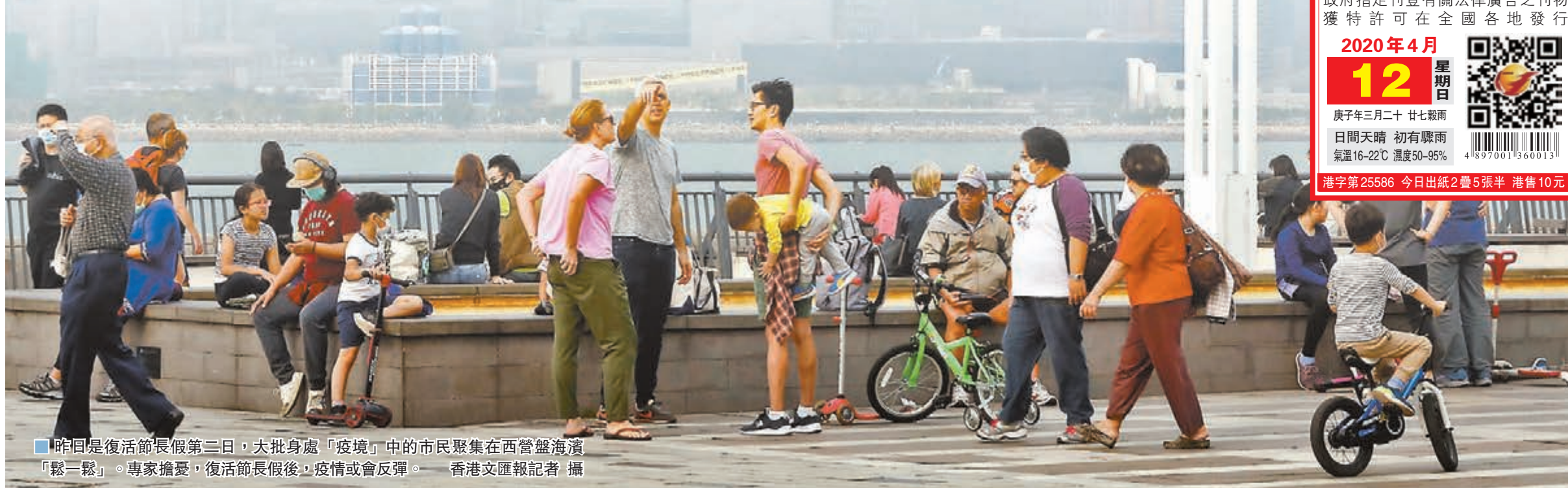
■昨日是復活節長假第三日，大批身處「疫境」中的市民聚集在西營盤海濱「鬆一鬆」。專家擔憂，復活節長假後，疫情或會反彈。