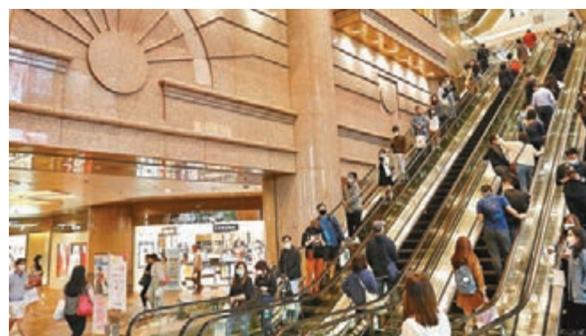
■銅鑼灣時代廣場人頭湧湧。