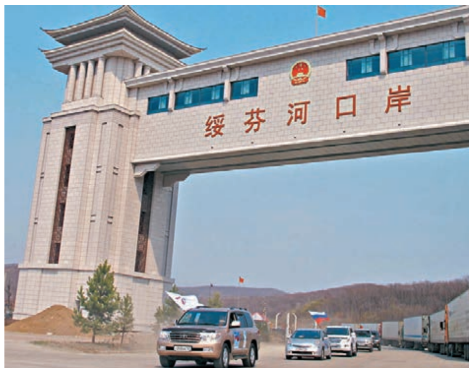
■新增的40例輸入病例從中俄邊境的黑龍江省綏芬河口岸從俄羅斯輸入。

國家衛健委新聞發言人米鋒昨日在京表示，近日部分鄰國確診病例數量增長較快，輸入中國數量明顯增加，要嚴格入境人員檢測、隔離等措施，最大限度減少關聯本地病例。這是官方在本周之內第二次提到來自鄰國的輸入壓力。