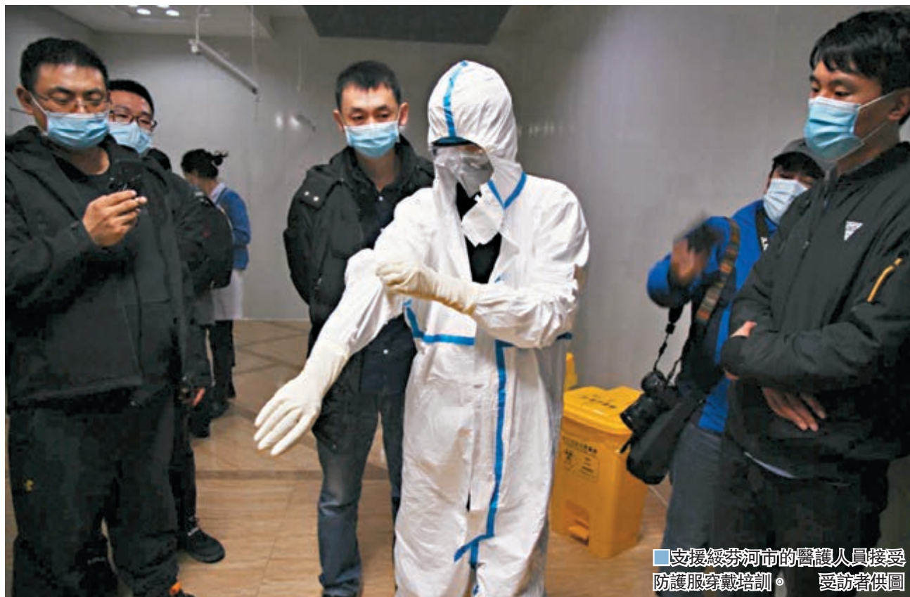
支援綏芬河市的醫護人員接受防護服穿戴培訓。