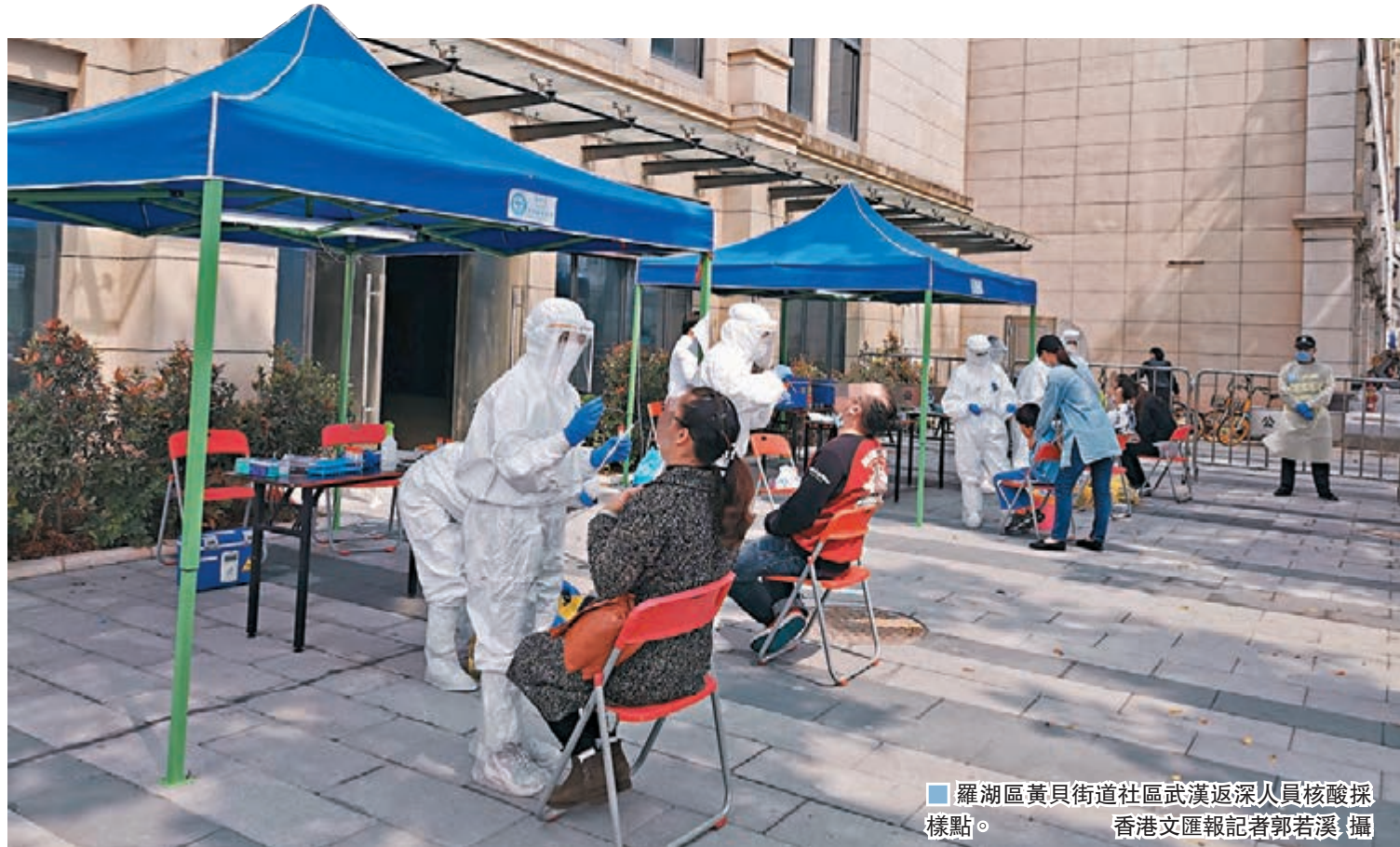
羅湖區黃貝街道社區武漢返深人員核酸採樣點。