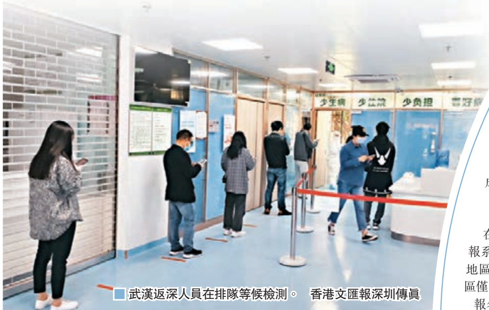
武漢返深人員在排隊等候檢測。

福田某小區保安更直言，沒有陰性報告令他們很為難。「8日有個武漢人回來，小區業主群裡鬧翻了，不少人提出只有採樣單據，沒有報告不能進小區。我們最後也只能勸這名業主臨時在社區指定的隔離酒店住一晚。」