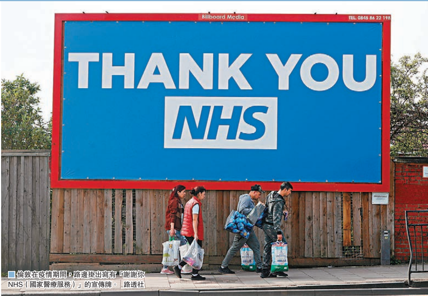
倫敦在疫情期間，路邊掛出寫有「謝謝你 NHS (國家醫療服務)」的宣傳牌。