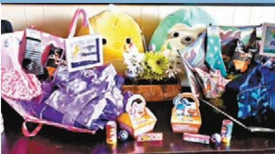
小朋友悉心佈置迎接復活節。

英國政府力促民眾只出外購買必需品，至今政府仍沒有把朱古力復活蛋列為必需品，但超市集團表明滿足顧客對復活節蛋的需求。Sainsbury's 已經獲得供應商保證朱古力復活蛋供應充裕，顧客到超市購買必需品時可以隨時選購各種與復活節有關