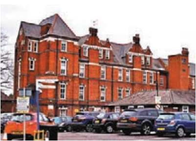
倫敦金士頓醫院早前有一名醫護人員感染病毒死亡。英國目前至少有 14 名醫護去世。