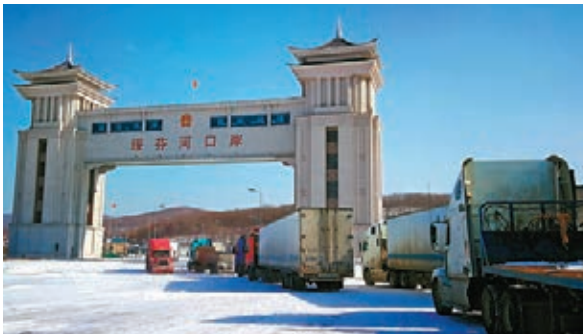
■百年口岸綏芬河因境外輸入病例持續增加，防疫壓力陡增。

香港文匯報訊 綜合記者王欣欣及中新社報道，據最新通報，4月7日黑龍江新增境外輸入確診病例25例，均為中國籍、來自俄羅斯，從綏芬河口岸入境。至此，黑龍江累計報告境外輸入確診病例87例，另外有境外輸入無症狀感染者144例。確診病例中經過綏芬河輸入的有84例，佔絕大多數。這是中