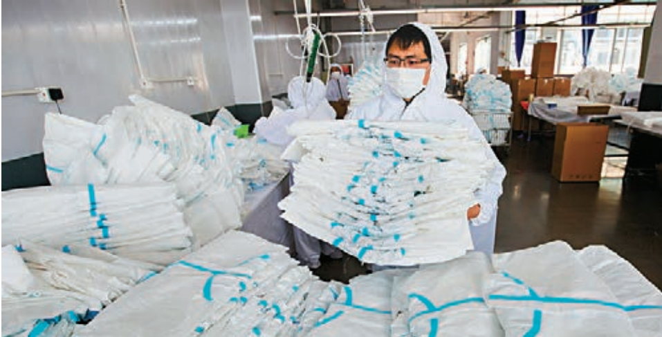
■截至3月底，已有100多個國家和國際組織向中國提出相關物資需求。圖為在江西省九江市都昌縣富德士服裝有限公司，該公司防護服日產量達到7,000套，已出口海外多個國家。

工信部消費品工業司副司長曹學軍表示，截至4月5日，內地一次性醫用防護服日產能達到150萬件以上，醫用N95口罩日產能超過340萬隻，重點跟蹤企業醫用隔離眼罩/面罩日產能達到29萬個，全自動紅外測溫儀日產能1萬台，手持式紅外測溫儀日產能40萬台。上述產品已基本能滿足國內的需求，企業正盡力組織擴大出口。