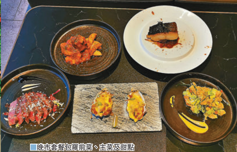
晚市套餐包羅前菜、主菜及甜點