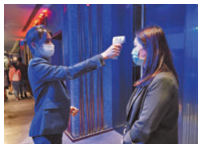
入場前，必須測體溫。