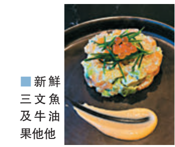
新鮮三文魚及牛油果他他