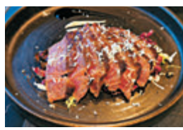
M5和牛西冷拌黑醋汁