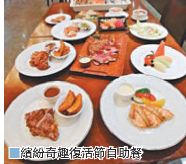
繽紛奇趣復活節自助餐

今個復活節，疫情下位於尖沙咀的九龍酒店倚窗閣推出繽紛奇趣復活節自助餐，多款味美的美食如岩鹽烤和牛、黑魚子溏心蛋等，以及造型別致的節日甜點如意大利芝士餅復活蛋、微笑鬆餅等，供食客任點，並直接送到食客的餐桌上。除了節日限定美食外，每位食客還可享用國際美味佳餚，如香芒燕窩龍蝦沙律、各款凍海鮮和即切烤肉等。