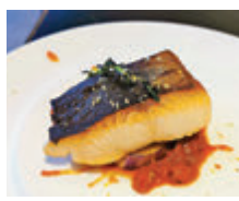
香煎鱈魚配番茄及百里香醬

及芝士焗製。在主菜方面，紅酒燴羊腩配烤新薯，用紅酒慢燴兩小時的羊腩，入口即融。香煎鱈魚配番茄及百里香醬，以番茄、新鮮檸檬皮及百里香等精心調製的醬汁。至於選擇澳洲M5和牛西冷拌黑醋汁則要加58元，不過以這個價格可品嚐到M5和牛，也甚值得。