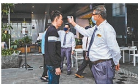
新加坡市民接受額溫測試。