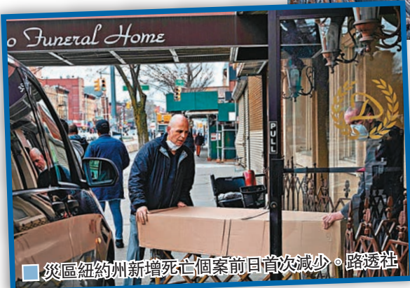
災區紐約州新增死亡個案前日首次減少。

倚賴大學或媒體追蹤、統計，疾病控制及預防中心(CDC)則剛於上周末發表新指引，指示官員上報死亡的確診患者，或在缺乏檢測工具下，若「情況合理、有一定說服力」，亦需要將死亡病例上報。