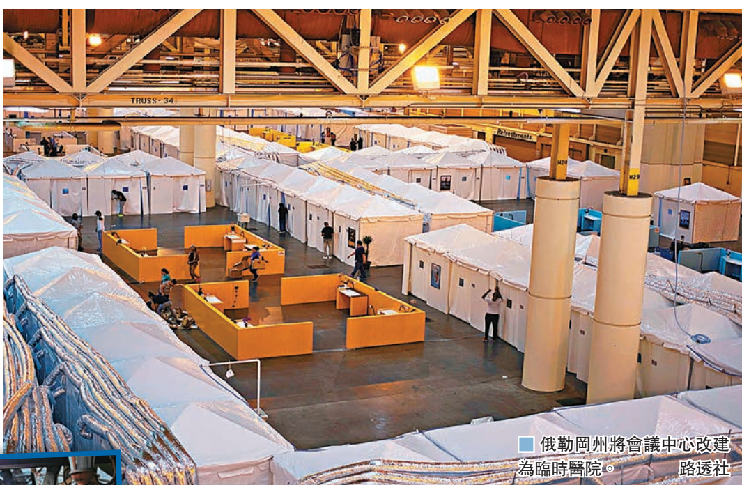
俄勒岡州將會議中心改建為臨時醫院。