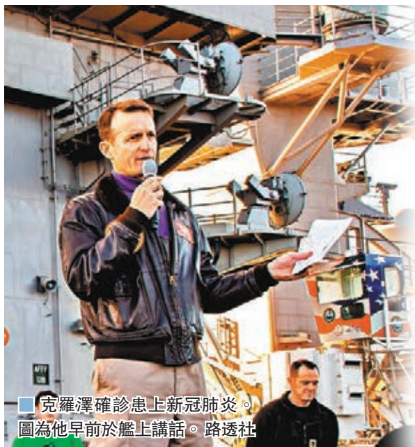
克羅澤確診患上新冠肺炎。圖為他早前於艦上講話。

美國海軍航空母艦「羅斯福」號爆發新冠肺炎，原艦長克羅澤上書高層要求容許船員上岸檢疫後，被軍方以信件外洩為由解除職務。報道指，克羅澤目前已經確診感染新冠病毒，但即使被革職，他仍不為「吹哨」的決定感到後悔；防長埃斯珀則繼續為軍方決定辯護，稱做法合理。