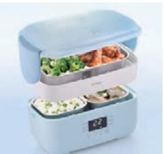
德國寶纖營蒸煮盒 FSL-103

德國寶的蒸煮飯盒 (纖營蒸煮盒 FSL-103) 採用食物級30413 鈦鋼精製，傳熱快之餘亦不怕會釋出有害物質，吃得安心。而且，一個飯盒具備6大功能模式，蒸煮、加熱、燉湯、煲粥、甜品、保溫一機搞定，性價比高。蒸煮飯盒間格非常實用，雙層四膽設計，內附一個雙連食物容器，以及兩個方形食物容器，做到「兩艇一湯，白飯夠裝」。如果不想飲湯，可以用一格來做甜品。以後即使是自備飯盒，都可以吃得比外面餐廳更豐富、營養更均衡。