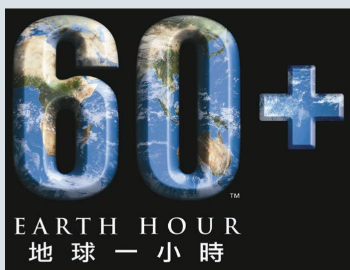
新地連續12年響應「地球一小時」，動員300座物業參與。

新鴻基地產發展有限公司 (下稱「新地」) 2020年連續第12年支持由世界自然基金會主辦的「地球一小時」全球熄燈行動，繼續成為本港最高參與度企業之一，實踐節約能源，推動健康及可持續生活。新地透過集團旗下物業管理公司，包括康業服務有限公司及啟勝管理服務有限公司，召集300座商廈、工廠、商場及住宅，於3月28日活動當晚一齊把非必要的燈關掉一小時。12年來，集團旗下物業的參與數目遞增逾兩倍，遍佈港九新界各地區。