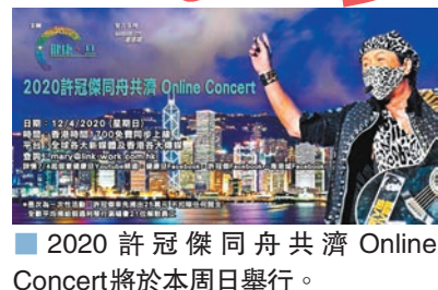
2020許冠傑同舟共濟Online Concert將於本週日舉行。