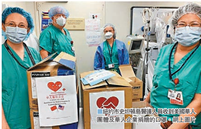
紐約市史坦頓島醫護人員收到美國華人團體及華人企業捐贈的口罩。

地抗擊疫情的艱難。我們銘記，在最困難的時候世界各地的朋友給了我們慰藉和幫助，其中很多是美國人，很多是紐約人。現在我們也願真誠回報他們的善意，與他們共渡難關。