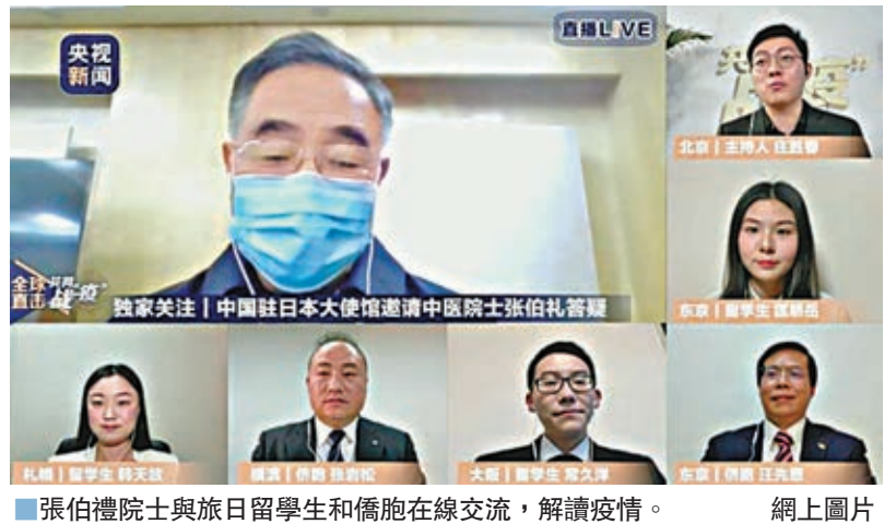
張伯禮院士與旅日留學生和僑胞在線交流，解讀疫情。

香港文匯報訊（記者張聰 天津報道）「SARS當時是5月份戛然而止，但是新冠肺炎不會，印度、印度尼西亞溫度很高了，但是還在蔓延。」中央指導組專家組成員、中國工程院院士、天津中醫藥大學校長張伯禮日前與旅日留學生和僑胞在線交流時表示，現在海外形勢嚴峻，輸入