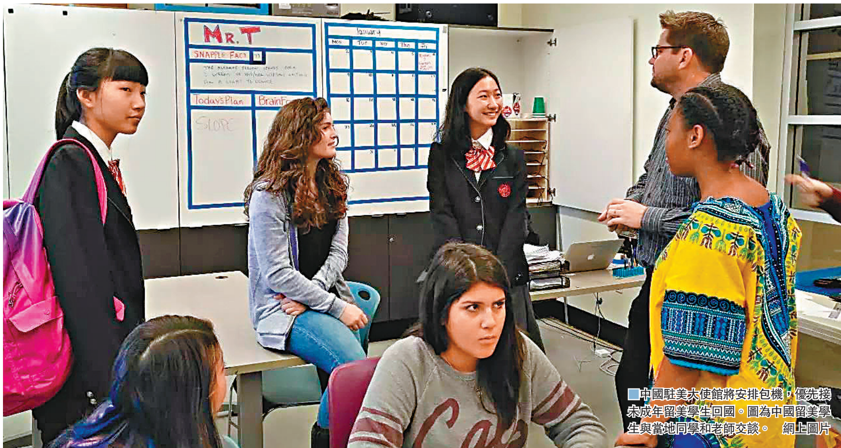
中國駐美大使館將安排包機，優先接未成年留美學生回國。圖為中國留美學生與當地同學和老師交談。網上圖片

中國民用航空局飛行標準司副司長韓光祖6日介紹，從3月4日到4月3日，民航共安排11架次臨時航班，協助在伊朗、意大利和英國的1,827名中國公民回國，接回人員主要以留學生為主。