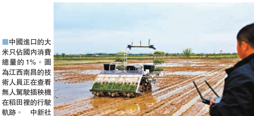
中國進口的大米只佔國內消費總量的1%。圖為江西南昌的技術人員正在查看無人駕駛插秧機在稻田裡的行駛軌跡。

他續稱，目前中國各地批發、零售市場大米、麵粉及食用油貨源充足，價格穩定。糧食生產加工企業復工向好，產能充沛。消費者完全沒有必要擔心糧食供應短缺及價格大幅上漲問題，無須集中大量購買在家中囤積糧食。