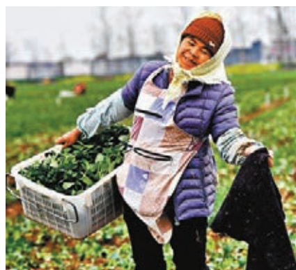
河南孫召鎮供港蔬菜基地近日組織農民搶收農時，保障粵港供應。 新華社

從歷史看，即便是在內地經濟最困難的時期，一些食品供應幾乎斷絕，供港物資也會給予強力保障。著名的「三趟快車」就是在1962年自然災害時期開通的。當時為保證內地現鮮活商品「優質、適量、均衡、應時」供港，總理周恩來親自指示開通分別自上海、鄭州、武漢（長沙）三地始發的編號為751、753、755三趟快車，每日載滿供港食品農產品，經深圳運抵香港。由於其定