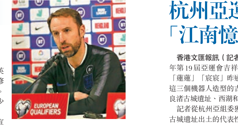
修夫基自願減薪。

香港文匯報訊(記者梁志達) 歐洲足球賽場停擺不僅嚴重打擊球會的銀根，也影響到各國足總的收入。英格蘭代表隊主帥修夫基據報近日與足總達成了協議，同意減薪大約三成。 英超多家球會因應疫情停賽而作出節流措施，但球員則暫未被開刀，因為英格蘭球員工會還未就整體減薪30%的幅度與聯賽會傾搨數，球員認為此舉會令英國庫房少了一筆可觀的稅務收入，反而對抗疫不利。 聯賽、盃賽、國際賽暫停也同時令各國足總的荷包大縮水，據報英格蘭足總在與「三獅軍團」領隊修夫基協商後，對方同意減薪三成。以他現時年薪計算，一年最多將少收100萬英鎊(約950萬港元)。 另一方面，利物浦日前官方宣佈，因受新疫情及英超停擺影響，球會將一些員工列為臨時停職狀態，這些員工將從英國政府處領到80%薪水，剩下20%才由利物浦承擔，這做法結果招來名宿加歷查和一群球壇人士的罵聲。 英超、意甲等歐洲主流聯賽重開