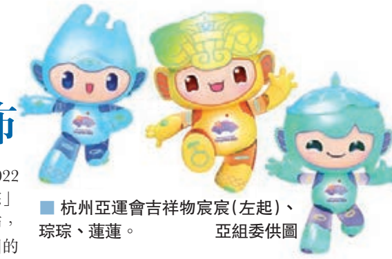
杭州亞運會吉祥物宸宸(左起)、琮琤、蓮蓮。亞運組委供圖

香港文匯報訊(記者王莉 杭州報導) 杭州2022年第19屆亞運會吉祥物「江南憶」組合「琮琤」「蓮蓮」「宸宸」昨通過互聯網向全球發佈，這三個機器造型的吉祥物分別代表了位於杭州的良渚古城遺址、西湖和京杭大運河三大世界遺產。 記者從杭州亞運組委獲悉，「琮琤」名字源於良渚古城遺址出土的代表性文物玉琮，頭部裝飾的紋樣取自良渚文化的標誌性符號「饕餮紋」，意寓「不畏艱險、超越自我」，整體展現了不屈不撓的創業精神；「蓮蓮」名字源於西湖接天蓮葉，蓮葉頭飾