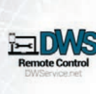
DWS Remote Control

基本免費，分享文件、複製貼上、遙距列印等功能均可免費使用，只需在需要存取的電腦安裝程式便可；但免費版只限個人用戶使用，若使用次數過於頻繁，可能會被限制存取。