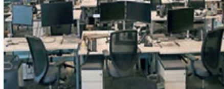
■ 有美國企業推行在家工作後，辦公室幾乎無人上班。