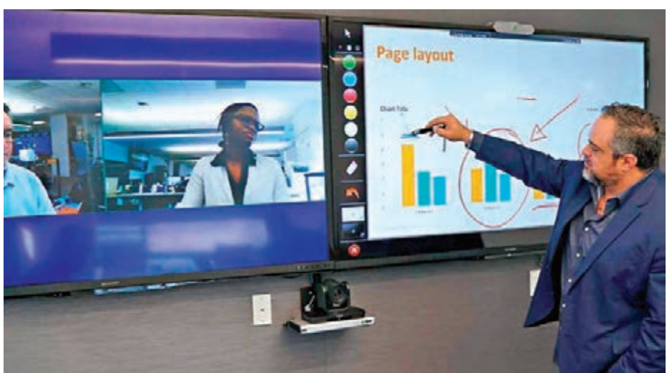
■ 企業與客戶舉行視像會議。