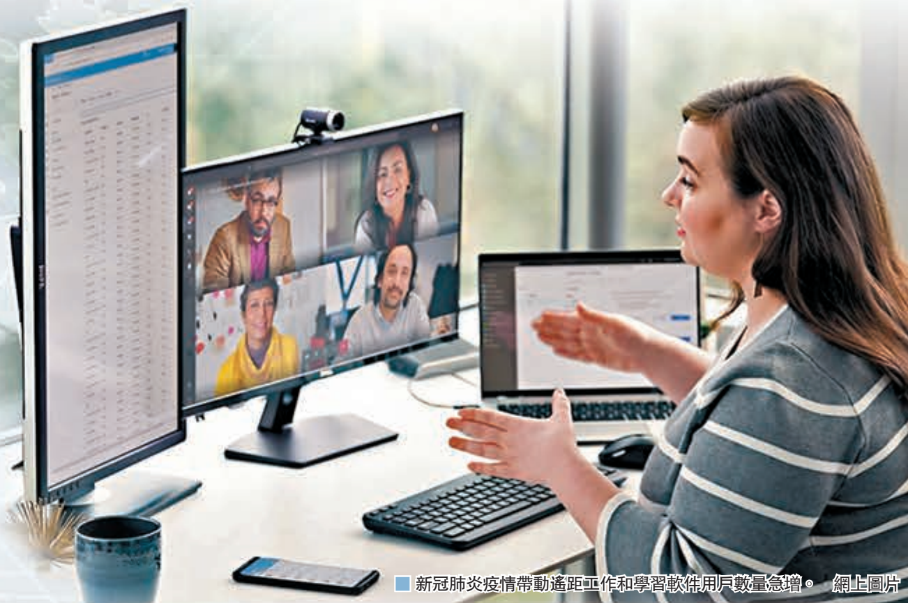
■ 新冠肺炎疫情帶動遙距工作和學習軟件用戶數量急增。網上圖片