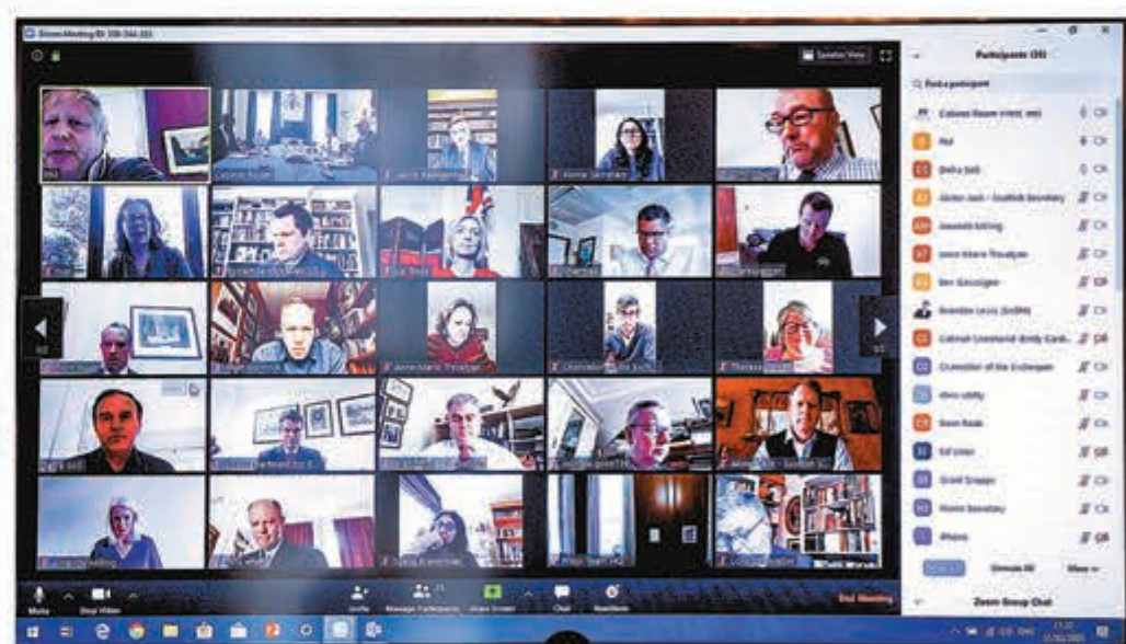
■ 英國政府近期亦使用視像會議討論抗疫政策。