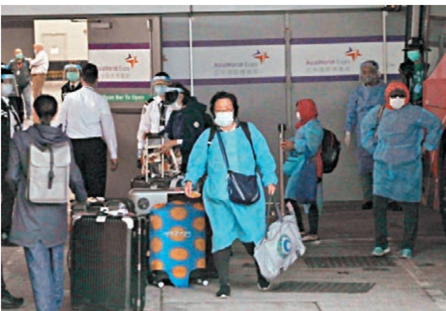
香港政府包機從秘魯接載數十名港人經倫敦返港後，隨即由專車送入亞洲博覽館的臨時檢疫中心檢疫。

醫管局發言人解釋，由於多間公立醫院急症室包括北大嶼山醫院，都陸續開設分流檢測站，局方檢視過兩個中心的服务模式及轉介人數後，決定整合兩個中心的服务。