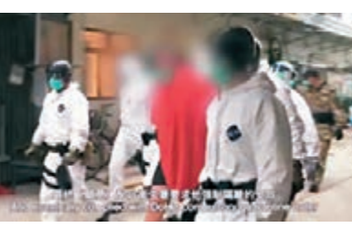
事主被勸服後被送往隔離中心。

而事實上，在2003年沙士期間，警察談判組已積極協助衛生署執行多次檢疫工作。張健斌說，2003年沙士期間，病毒傳染比較集中，覆蓋面沒這次新冠病毒爆發那麼厲害，社會氛圍也大大不同。他指今次爆發的新冠