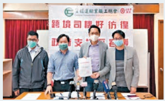
工聯會要求政府資助跨境貨運司機進行測試。

香港文匯報訊（記者 鄭治祖）日前深圳市政府宣佈，周五起所有經深圳口岸入境的跨境貨運司機須自費提供7天內病毒檢測陰性證明，確保並無感染新型冠狀病毒。從事跨境運輸業的貨運司機擔心新措施加重前線司機的負擔，影響收入。工聯會要求特區政府全額資助跨境貨運司機進行病毒測試，並已約見運輸及房屋局局長陳帆明日會面，商討更多細節。